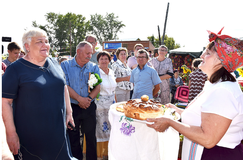
Представители национальных культур встречали дорогих гостей хлебом-солью