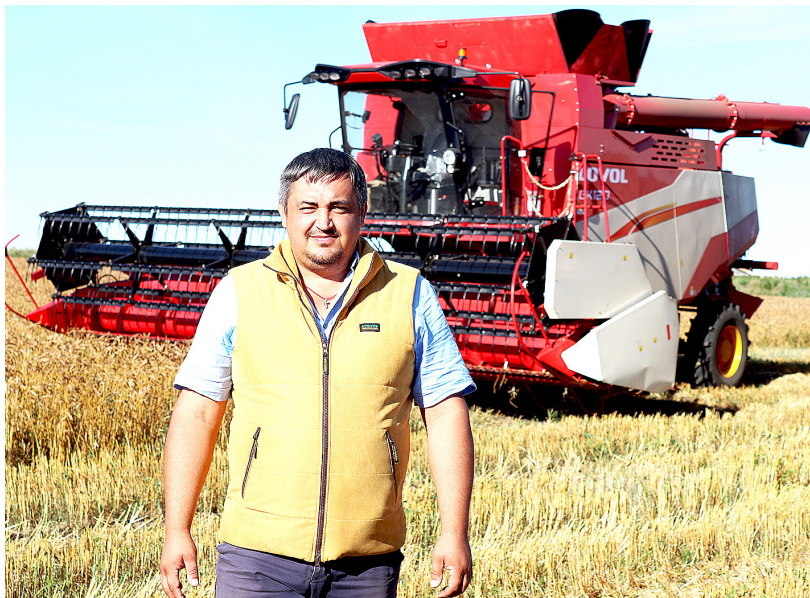
Поставки техники из Китая в Россию продолжают

В условиях юга Тюменской области, по словам экспертов, машина имеет право на жизнь при полной загруженности отечественных