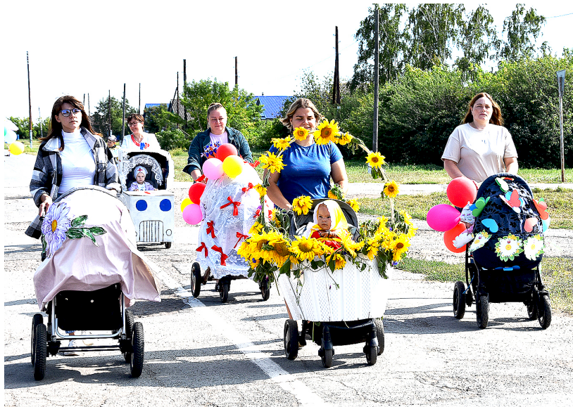
Ярким был парад колясок. Мамы малышей проявили смекалку и фантазию