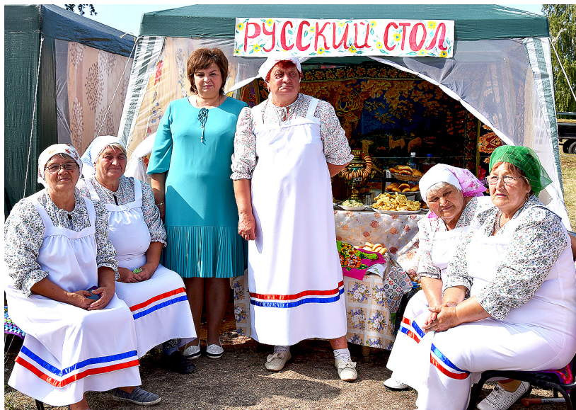
Гагарьевские умелицы щедро накрыли стол русскими блюдами