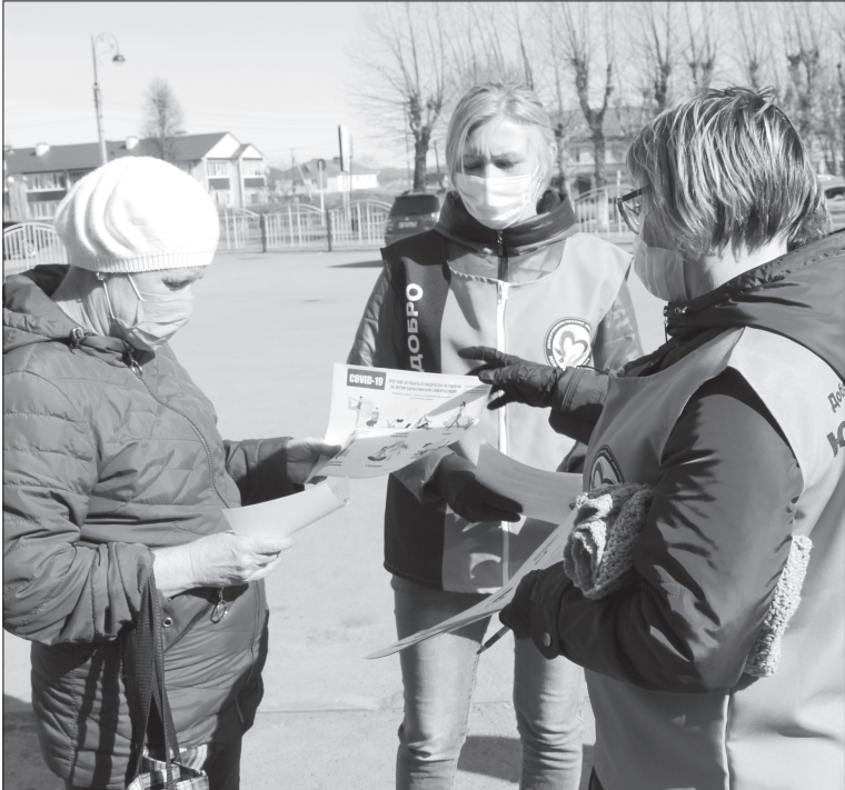
Волонтеры Центра «Лидер» проводят рейды, в ходе которых рассказывают о мерах безопасности, необходимости соблюдать режим самоизоляции

Татьяна АГАПИТОВА