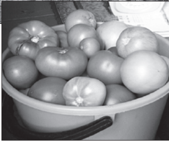
Эксперимент показал эффективность способа выращивания томатов на двух корнях