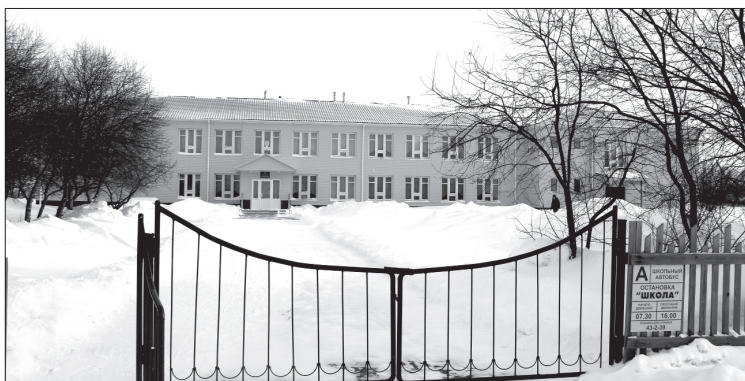
Один из социальных объектов села – Бушувская основная школа

Бюджет сельского поселения в 2019 году исполнен по расходам на 92,9 процента. Что касается доходов – это в основном безвозмездные поступления из вышестоящих бюджетов, дотации и субвенции. Из налоговых поступлений – налог на доходы физических лиц (при плане 35 тысяч рублей исполнено 105 тысяч рублей), налог на имущество физических лиц (при плане 19 тысяч рублей исполнено 17 тысяч рублей), земельный налог (при плане 363 тысячи рублей исполнено 260 тысяч рублей). Таким образом, недоимка по налогам составила 34 тысячи рублей.