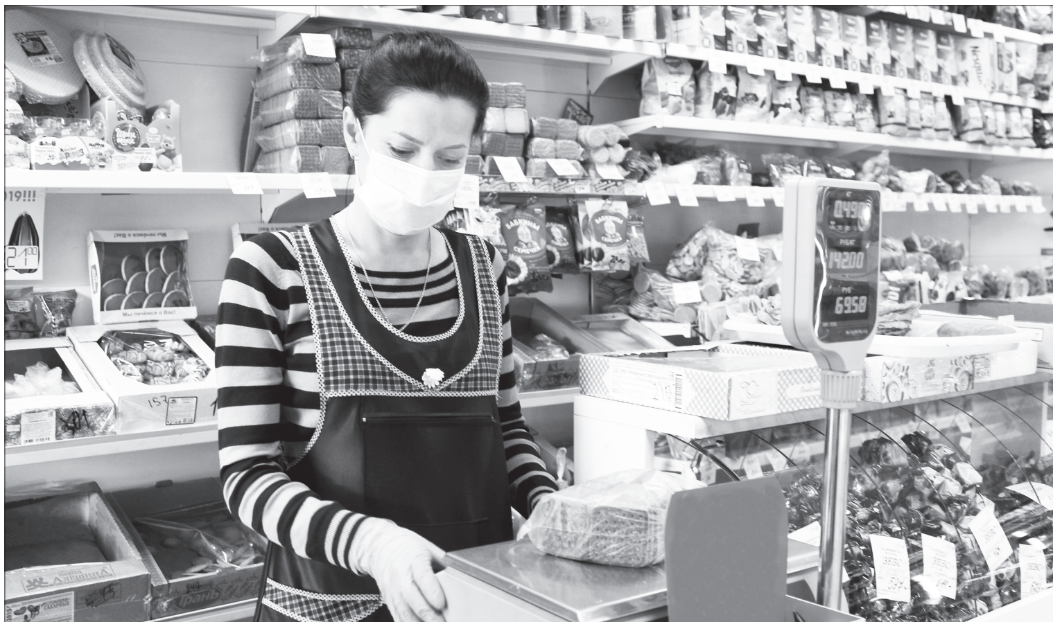
Режим самоизоляции не касается продавцов продовольственных магазинов и аптечных пунктов. Они из тех, кто обязан каждый день ходить на работу – в места массового скопления народа. А потому средства защиты, маски и перчатки, обязательны