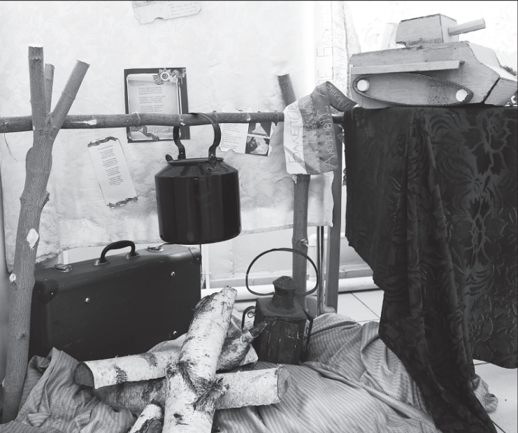
Инсталляция, посвящённая 75-летию Победы в Великой Отечественной войне, развернулась в холле первого корпуса ЮСОШ