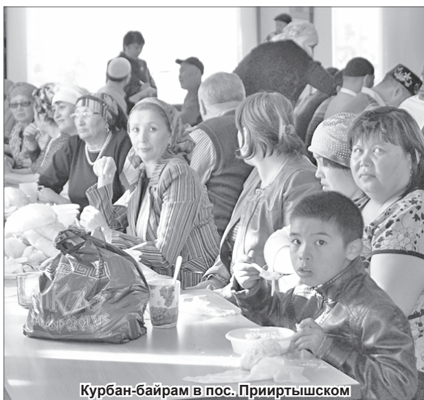
Курбан-байрам в пос. Прииртышском

самбля «Родник». А поделки за чаепитием проходили в уютной домашней обстановке, всех объединяли общие воспоминания, песни под гармонь. Не остались без внимания и те пенсионеры, кто не смог прийти на встречу, накануне им