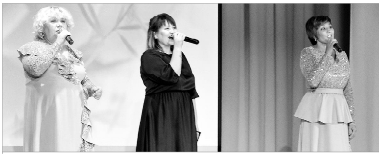
Музыкальный подарок педагогам района

Проект «Достижения.РФ» создан в рамках подготовки международной выставки-форума «Россия», которая откроется на ВДНХ 4 ноября 2023 года.