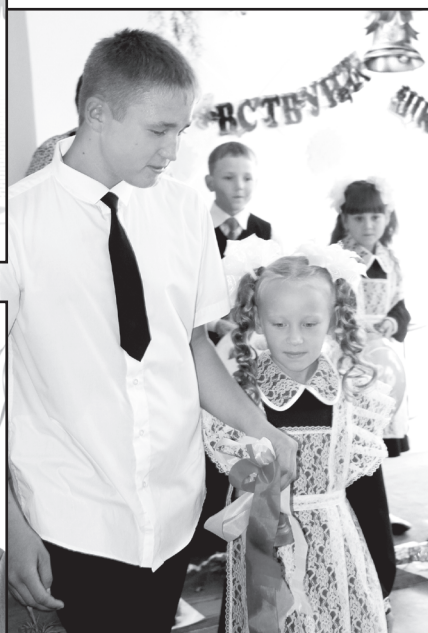
Звонок на урок