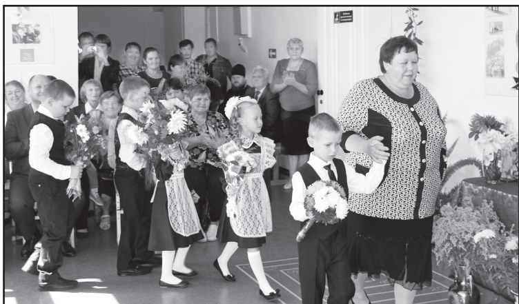
Почётные участники линейки – первоклассники

Когда речь заходит о малокомплектной сельской школе, думаю о том, что ни в одном другом образовательном учреждении так не радуются каждому ученику, как здесь.