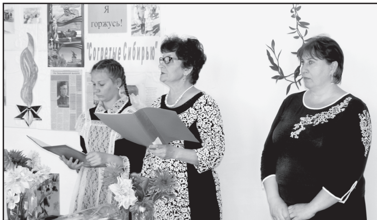
Открытие «Школьной регаты»