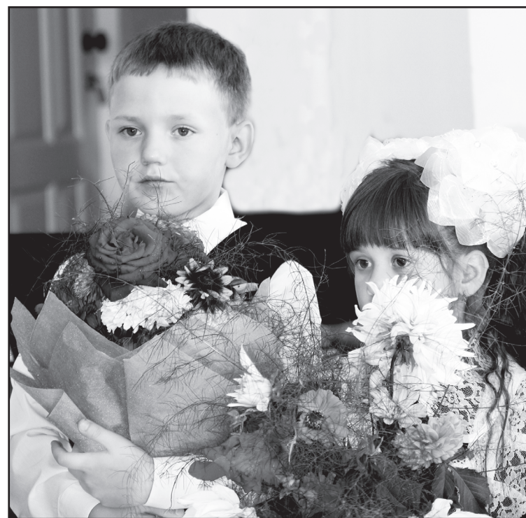
Первый раз в первый класс