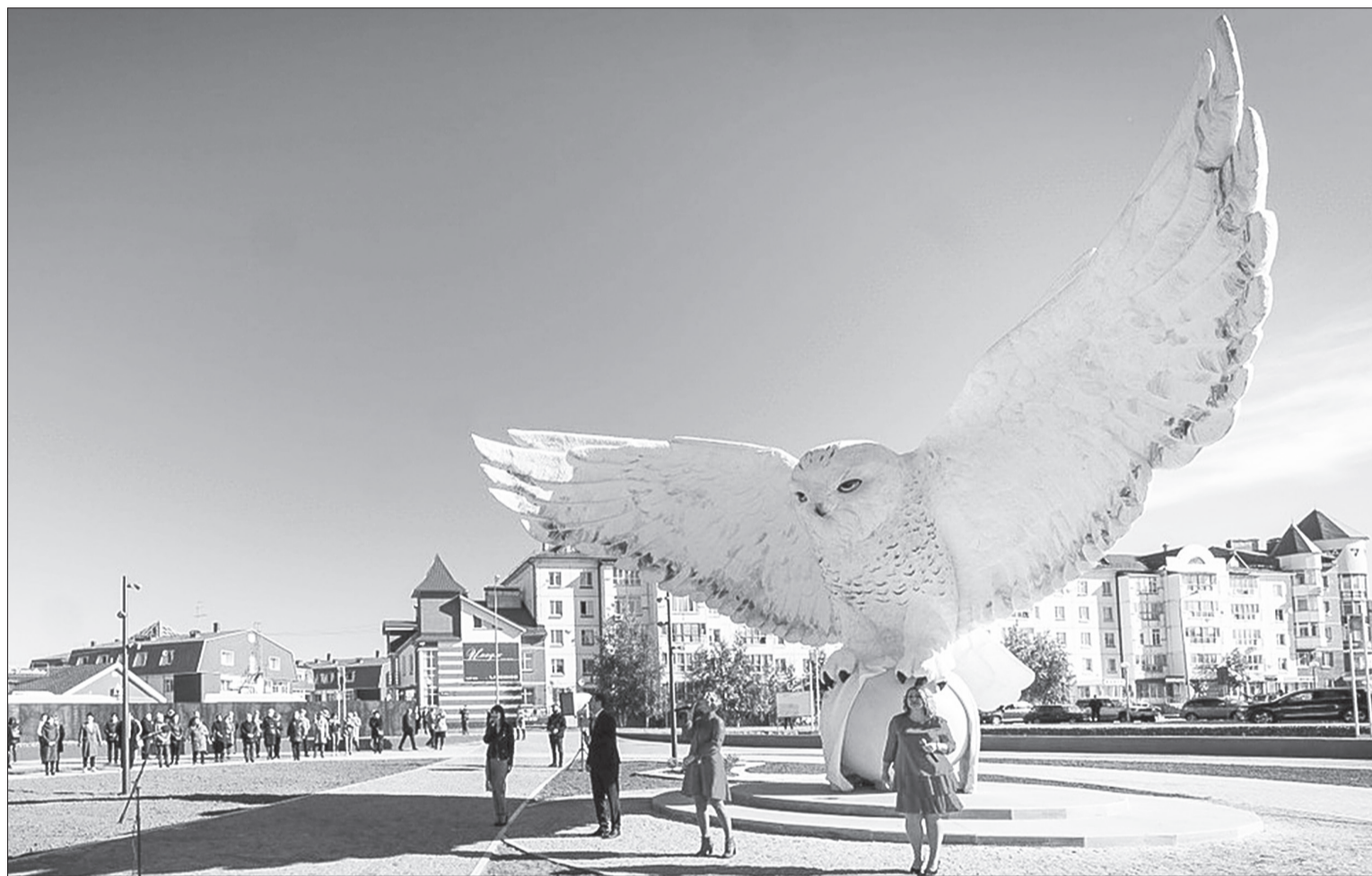
Новая набережная в Белоярском — яркий пример креативного подхода к благоустройству городских территорий