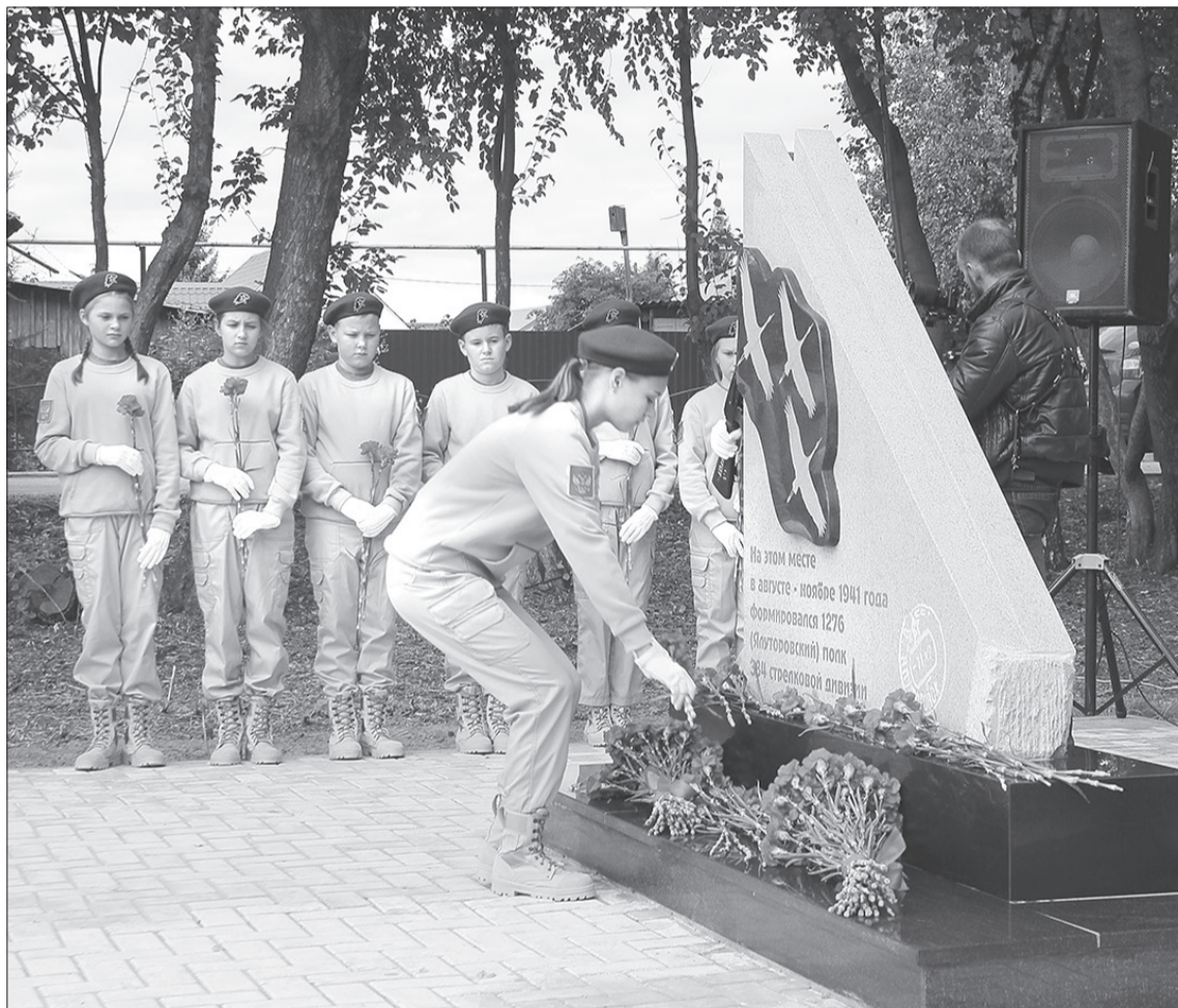
Новый мемориал несомненно станет ещё одним местом проведения ежегодных митингов, посвящённых Дню Победы

Постамент памятника облицован чёрным гранитом. Площадка выполнена из брусчатки, а тротуар соединяет её с ул. Советской