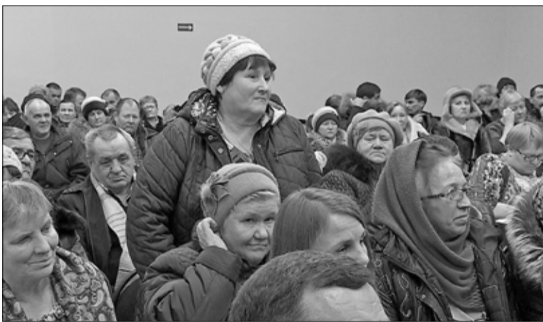
На сходе в Средних Чирках обсудили больше двадцати вопросов