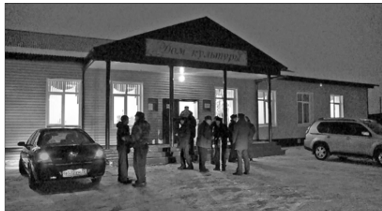
Обновлённый дом культуры – отличный подарок для населения