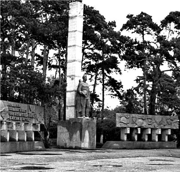
• 9 мая 1985 года на привокзальной площади Заводоуковска открыли мемориал в честь земляков, погибших на фронтах Великой Отечественной войны. На постаменте тогда стояла фигура солдата, выполненная местным скульптором Николаем Горбачёвым.

Сейчас трудно представить городскую привокзальную площадь без мемориального памятника. Казалось, он был здесь всегда. Но четыре десятилетия назад на этом месте располагалась районная Доска почёта.