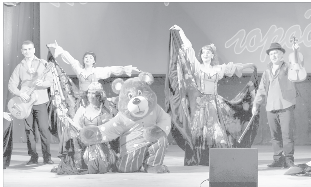
Этот ансамбль вне сцены - сотрудники местной полиции

Все участники не остались без внимания и были награждены специальными призами. Лучшие номера фестиваля можно будет увидеть на гала-концерте, который состоится 1 апреля во Дворце культуры, в 14-00.