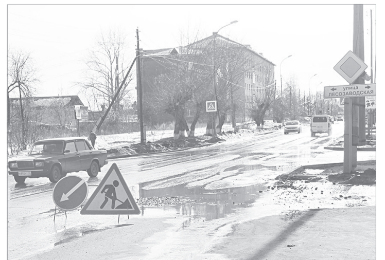
Яму на перекрёстке Свободы-Лесозаводской устранили быстро, но ущерб автолюбителям она нанести успела

Но особую славу успела заслужить лужа близ перекрестка улиц Свободы и Лесозаводской, устроив в этот понедельник автомобилям ялуторовчан настоящий краш-тест. Несколько пробитых колёс и большое количество звонков в редакцию на телефон дежурного по номеру - вот результат дорожных испытаний.