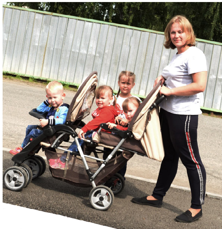
Семейство Достоваловых дружно вышло на прогулку