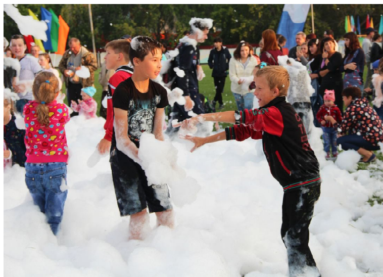
Пенная вечеринка в самом разгаре