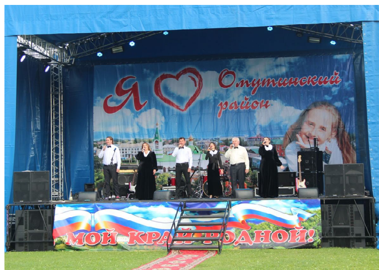
Артисты районного ДК исполняют песни о родном крае