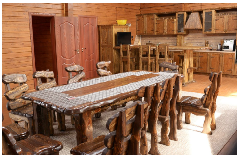
Комфортная гостиница рассчитана на восемь мест