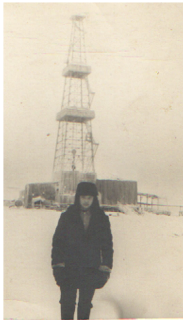
Молодой буровик идет со смены (1969 г.)