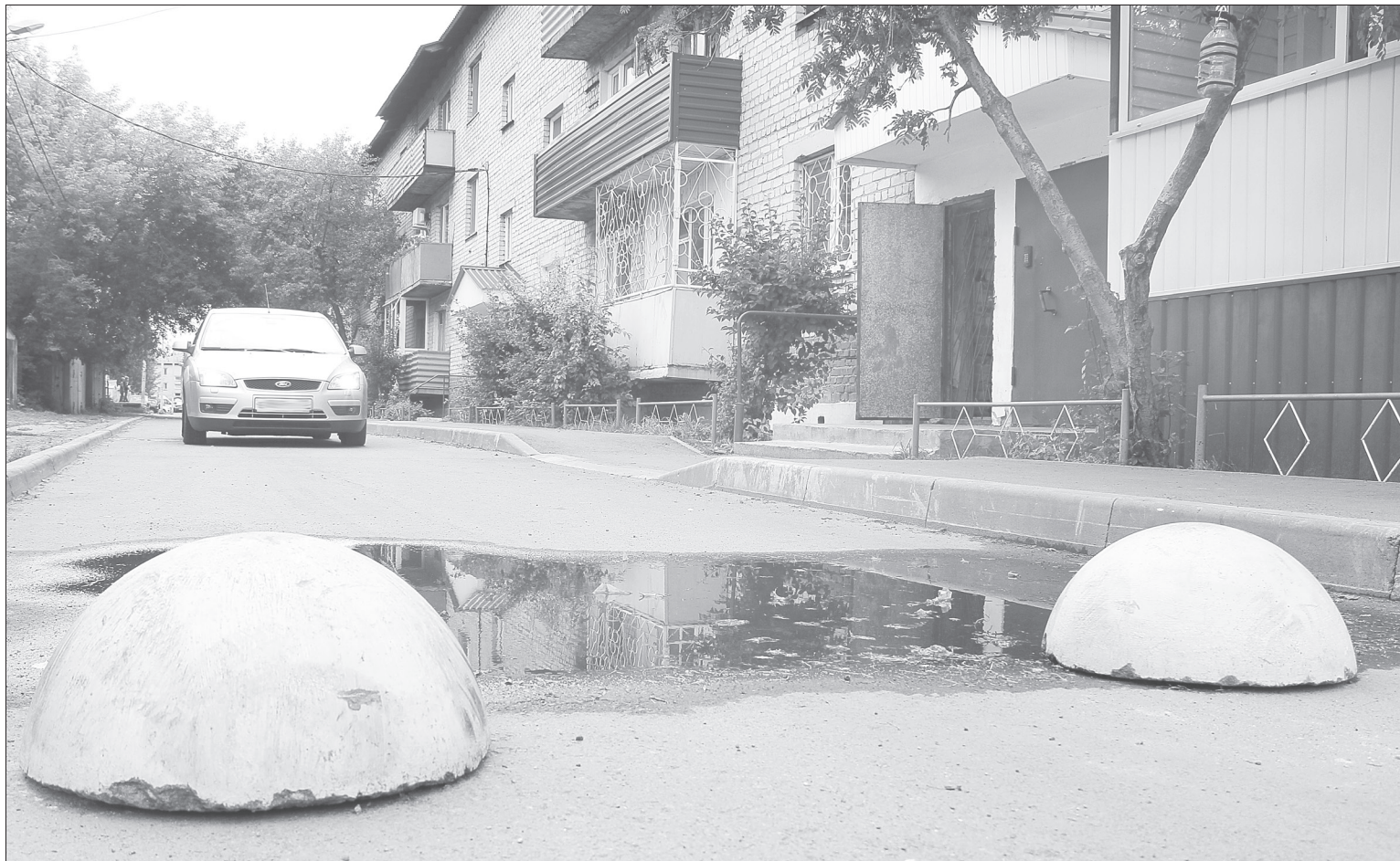
Эти искусственные неровности размещены на дворовой территории домов №№ 3-9 на улице Механизаторов

Как сообщили в администрации города, купить горячительные напитки не получится с 8-00 до 21-00 по местному времени в рабочие дни 2 и 11 сентября. Первый запрет связан с тем, что школьный праздник приходится на выходной, поэтому по закону ограничение переносится на следующий день, второй – областной День трезвости.