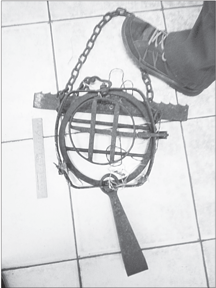
Капканы, обнаруженные в местном лесу, приличных размеров и вполне могли нанести вред человеку

■ СПРАВКА «ЯЖ». С информацией об охотничьих ресурсах, зонах нагонки собак, общедоступных и закрепленных угодьях можно ознакомиться по ссылке: clck.ru/No8UB или наведя камеру телефона на QR-код.