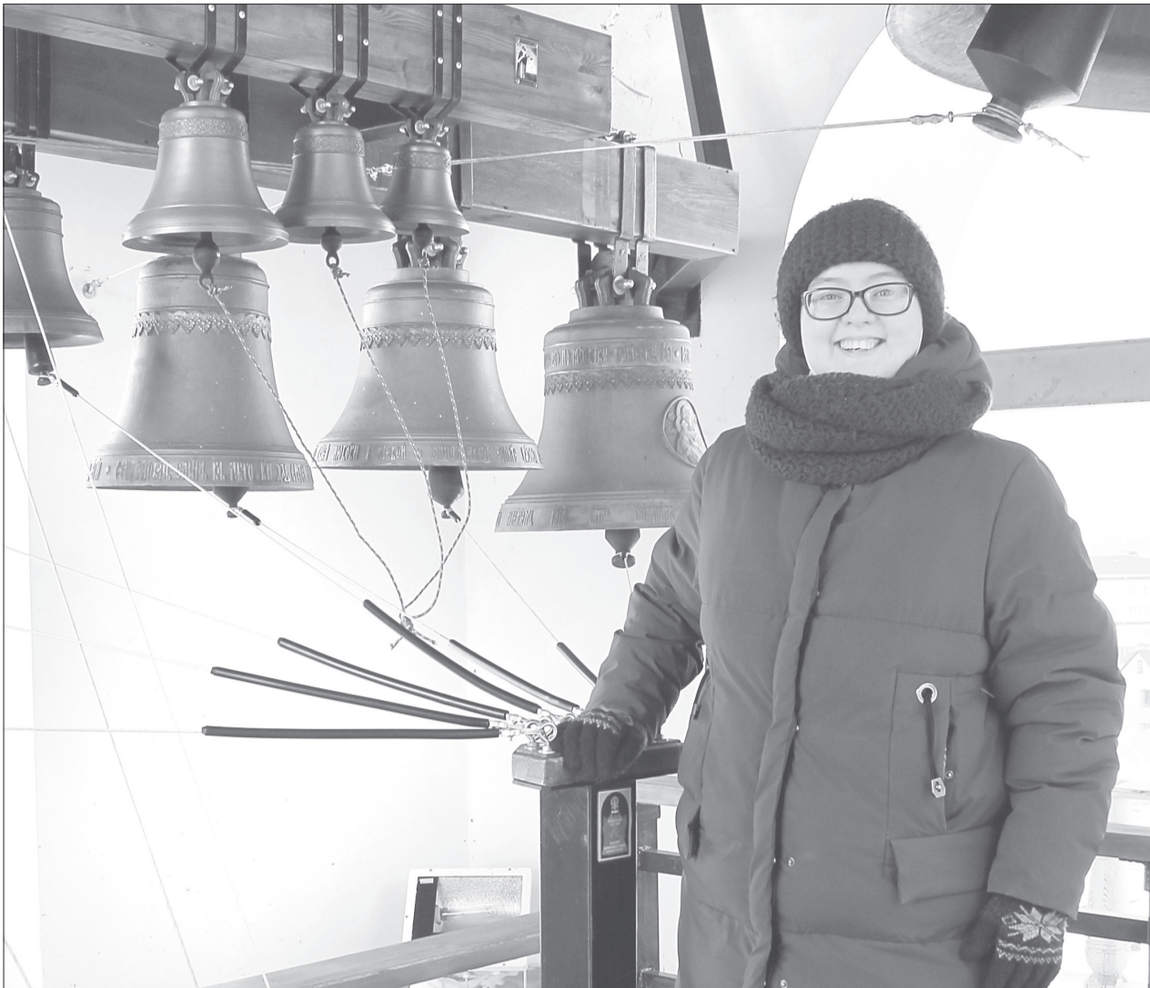
Девушка без особого труда управляется с колокольными басами и подголосоками