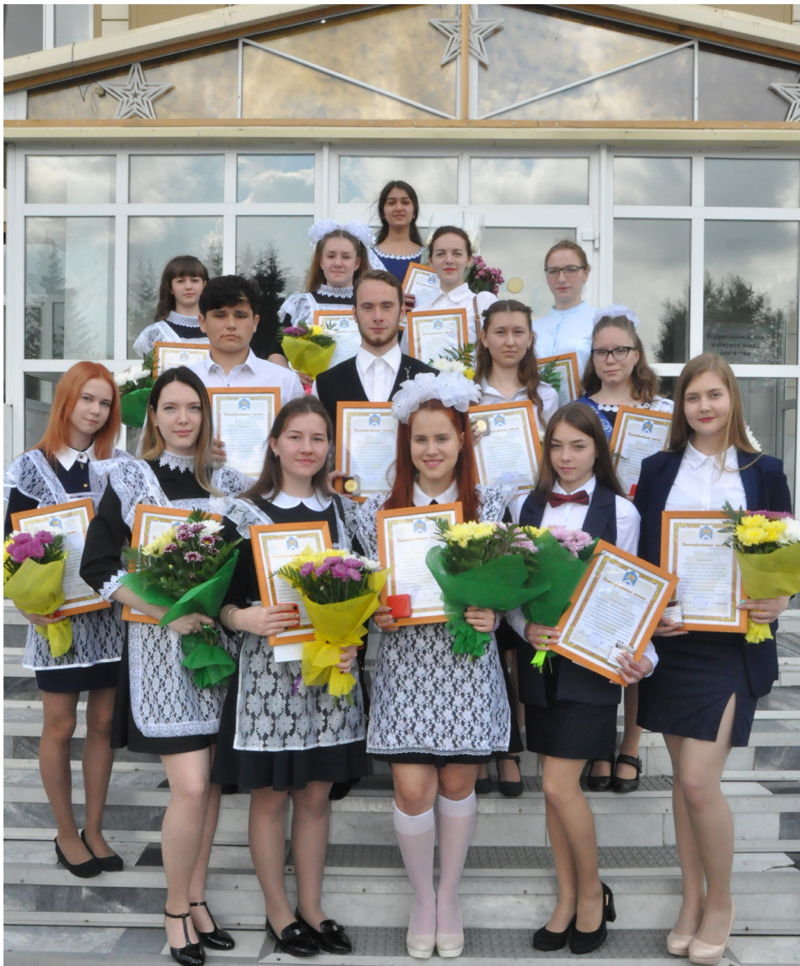
|| Фото автора

О работе дошкольных учреждений рассказала начальник отдела образования О.В.Быбина. Согласно данным на 1 апреля 2018 года, на территории района проживает 2021 ребёнок в возрасте от рождения до 7 лет, 75,7% из которых охвачены дошкольным образованием. Отдельно затронула Ольга Владимировна и тему здоровья воспитанников. В результате медицинского осмотра у детей выявлено следующее: у 4,5% ребятшек нарушение органов зрения, у 3,5% – дефицит массы тела, у 4,7%, – избыточная масса тела, анемия у 2,4% мальчишек и девочек, нарушение осанки – у 5,6% обследованных. Вне повестки совещания глава района Н.В.Теньковский заострил внимание всех присутствующих на подготовке к приближающемуся 95-летию муниципалитета и призвал проявить ответственность и неравнодушие.