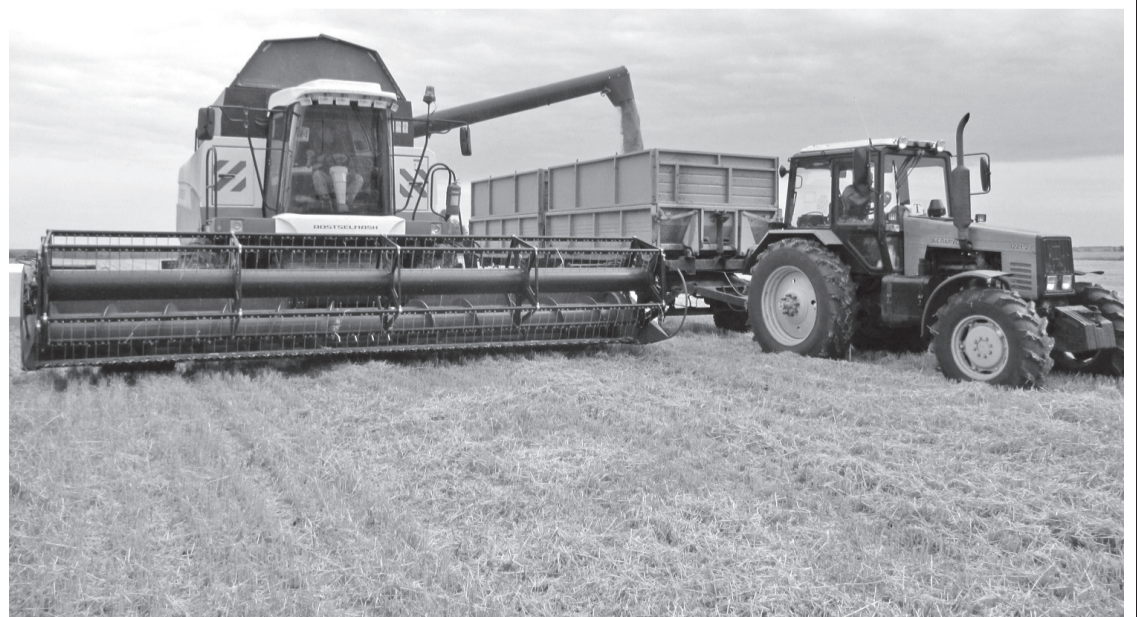
• Вот оно, золотое зерно, нового урожая!