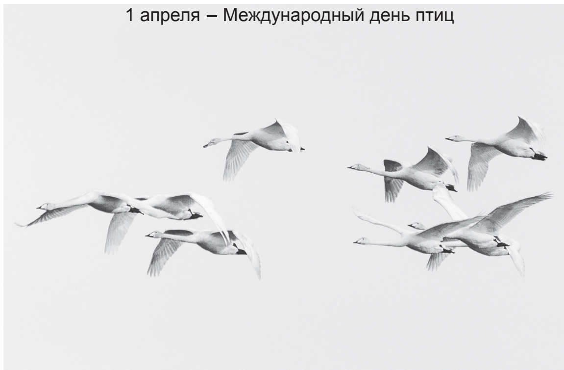
После долгой зимовки лебеди возвращаются домой.