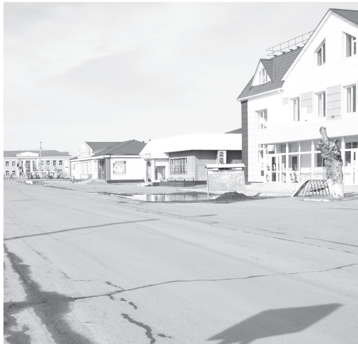
Все остались дома.