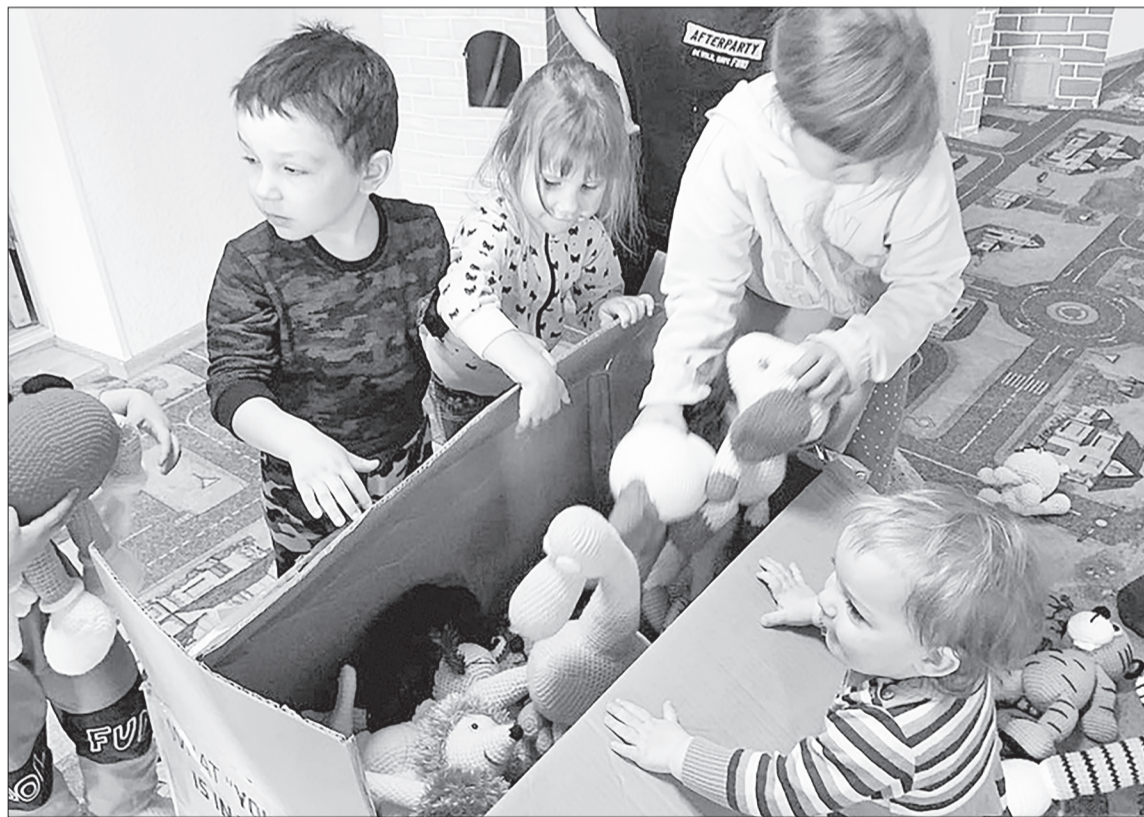
■ Дети из Центра социальной реабилитации «Тюменский» очень обрадовались подаркам.

Например, активисты местного «Женского движения» совместно со специалистами Киндерского сельского Дома культуры передали в Центр социальной реабилитации «Тюменский» мягкие игрушки, которые собственноручно связали. Работники Центральной районной библиотеки подготовили порядка 150 экземпляров книг, среди которых художественная, детская и научно-популярная литература, для жителей Луганской Народной Республики. Кстати, акция «Книги – Донбассу» продолжается, и любой желающий может поделиться мудростью веков с нашими