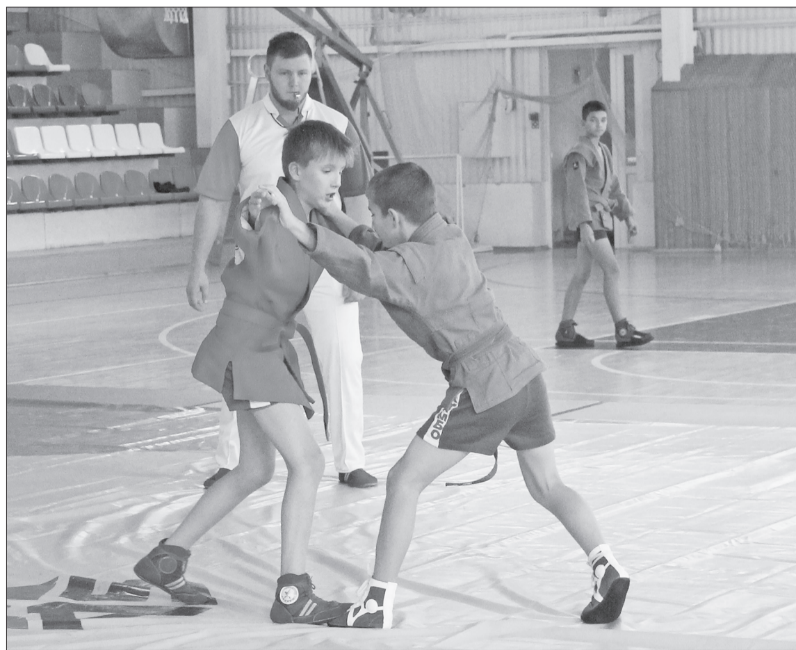
Момент спарринга по правилам спортивного самбо.