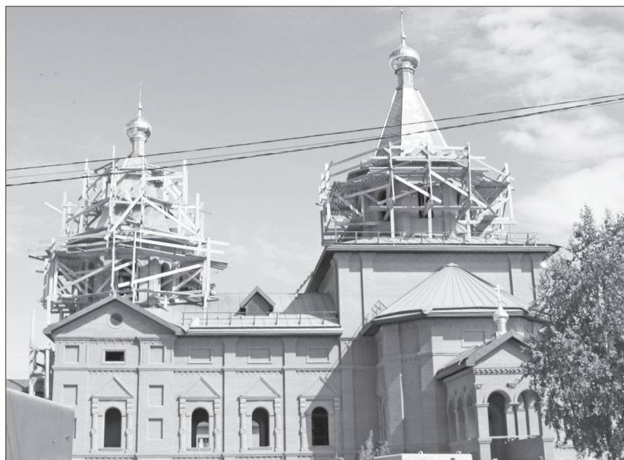
В селе Антропово возводится храм Николая Чудотворца.