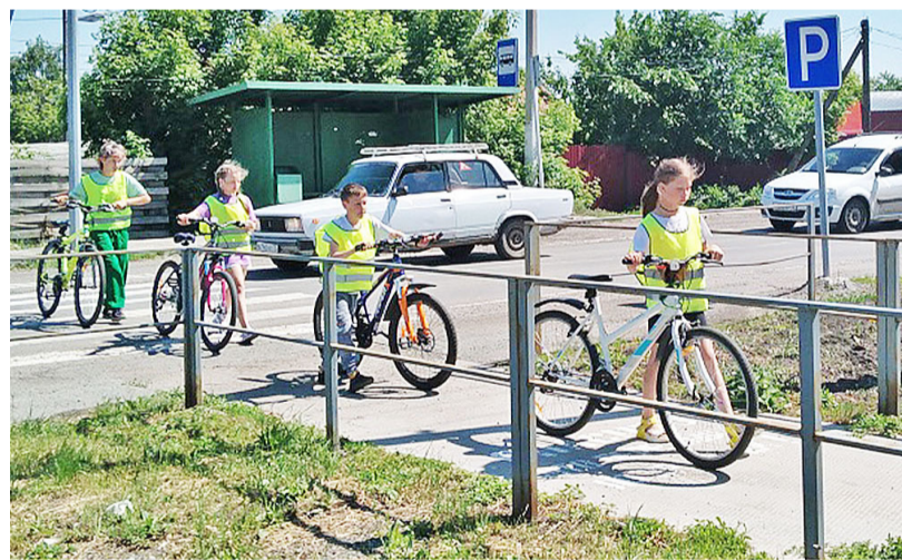
Дорожную грамоту нужно учить с детства

Для воспитанников лагеря дневного пребывания на базе Новоселёвской школы сотрудники ГИБДД провели мастер-класс по изготовлению световозвращателей «Засветись в темноте». Инспектор по пропаганде безопасности дорожного движения отделе-