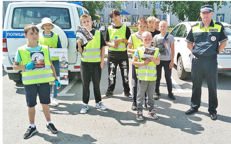
Участники акции призывали водителей быть внимательными на дороге

ко всегда перевозит своих детей в автокресле.