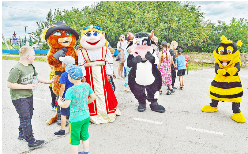
Большие ростовые куклы веселили на празднике детей и взрослых