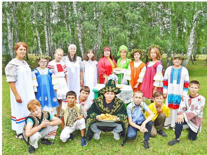
Казанские школьники и педагоги центра развития детей на мероприятии «Хоровод дружбы»

дня школьники проводят на свежем воздухе: во дворе школы, где центру развития детей выделено несколько кабинетов, или в лесопарковой зоне на территории стадиона. Здесь подростки охотно разучивают игры разных народов. Кроме этого, школьников вывозят в бассейн, на экскурсии в библиотеку, музеи (Казанский и Ильинский), центральный парк, где для ребят организуются игры-квесты. Вторая половина дня в лагере посвящена кружковой дея-