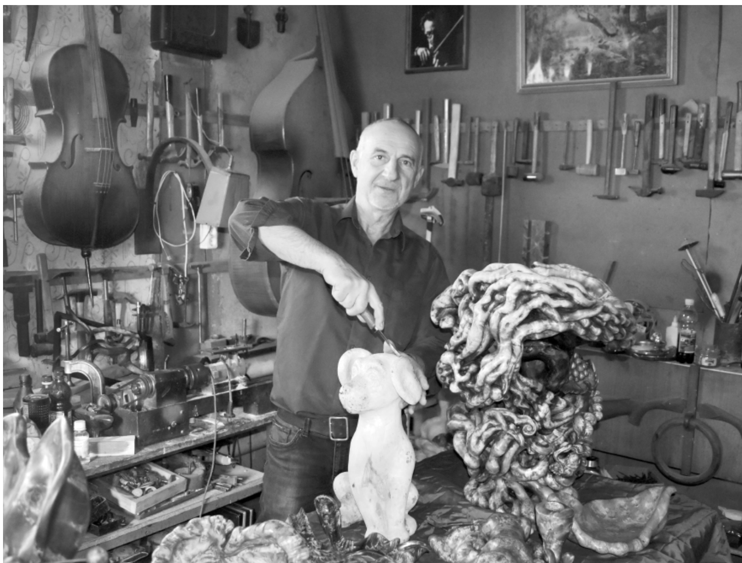
Работа с деревом не терпит суеты. Поэтому, чтобы коряга превратилась в скульптуру, может пройти два-три года