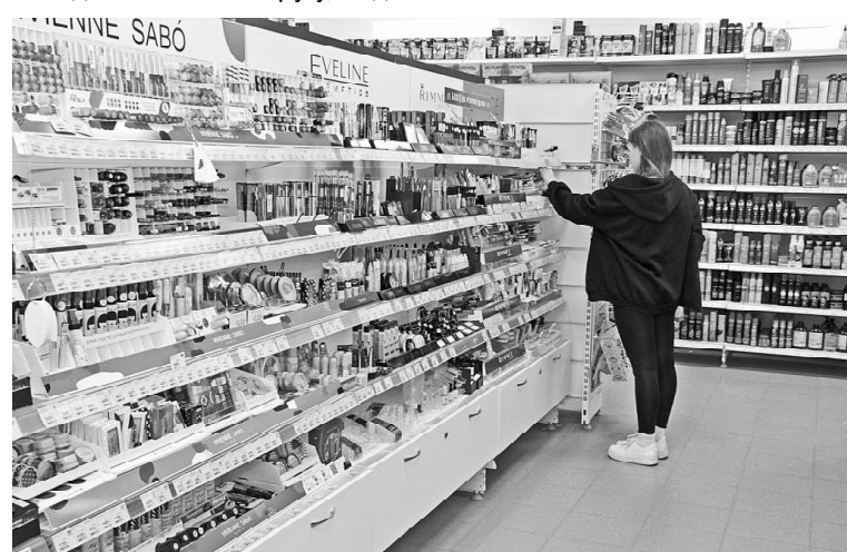
➤ «Магнит – Косметик»