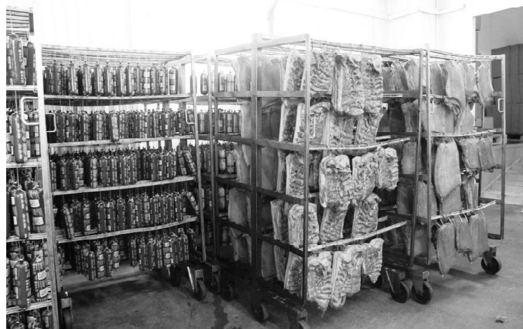
➤ Готовая продукция на мясокомбинате

В результате глубокой переработки пшеницы также получают спирт. По этой технологии практически не остаётся отходов. Мука расщепляется на глютен — готовый продукт, крахмал А, который идёт на приготовление глюкозного сиропа для штамма лизина, и крахмал Б — он служит сырьём для производства спирта. Журналисты посмотрели на спиртовое производство, а заодно побывали на складе готовой продукции. Спирт экспортируют в другие страны, например, в Турцию. Его качество — на высоком уровне. Этому свидетельствуют