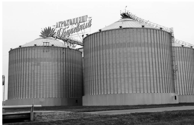
➤ Самые объёмные бункеры Агрохолдинга

В последнее время вырос спрос на полуфабрикаты — замо-