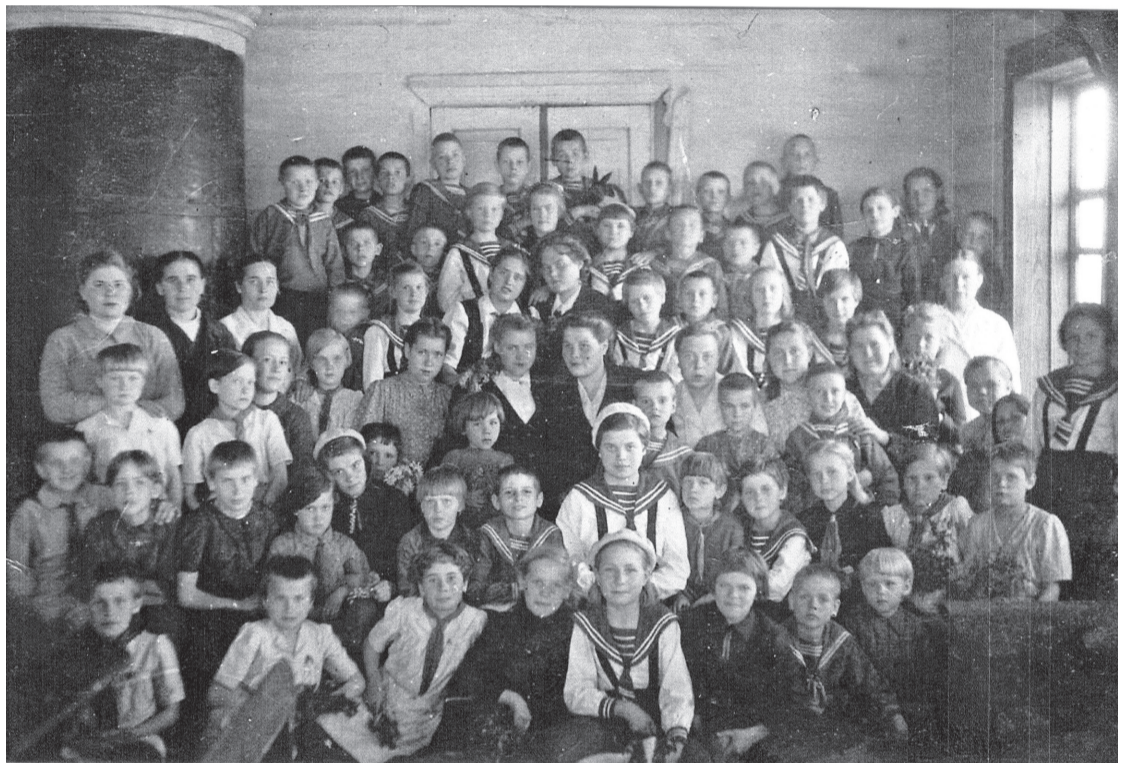
• Воспитанники Бигилинского детского дома, созданного в начале Великой Отечественной войны для ребят из блокадного Ленинграда. Конец 1940-х годов.

Блокада Ленинграда началась 8 сентября 1941 года и продлилась 872 дня