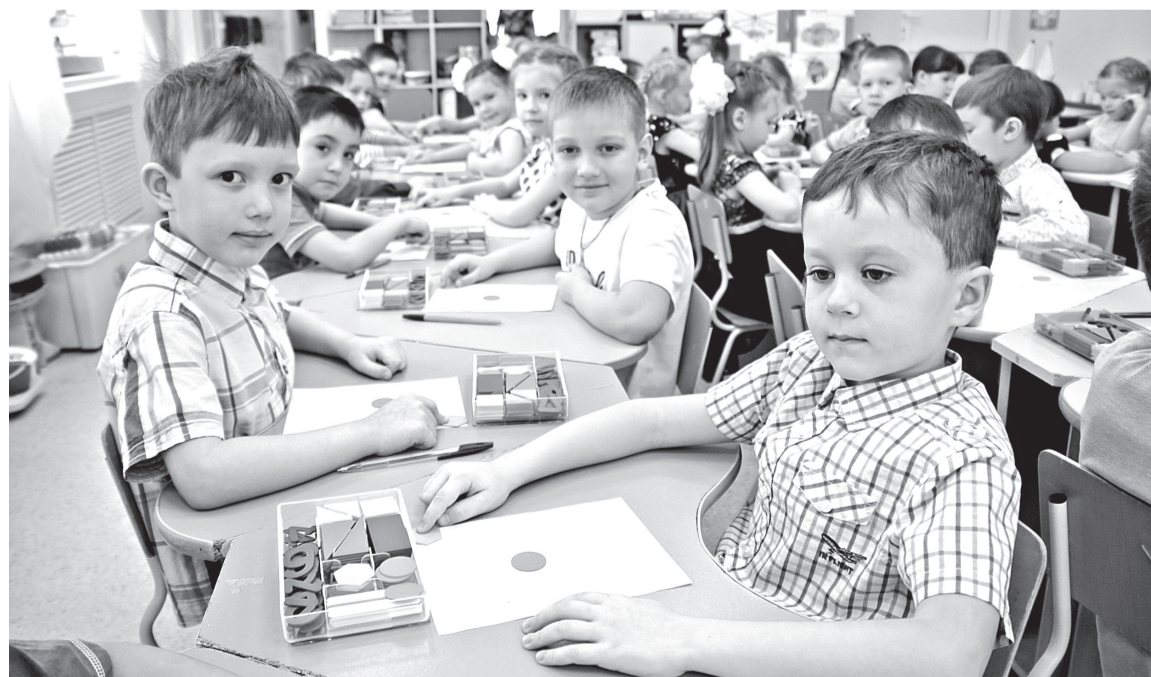
• В Заводоуковском городском округе охват детей от трёх до семи лет дошкольным образованием составляет 100%.

Подготовила Татьяна ВОЕВОДИНА