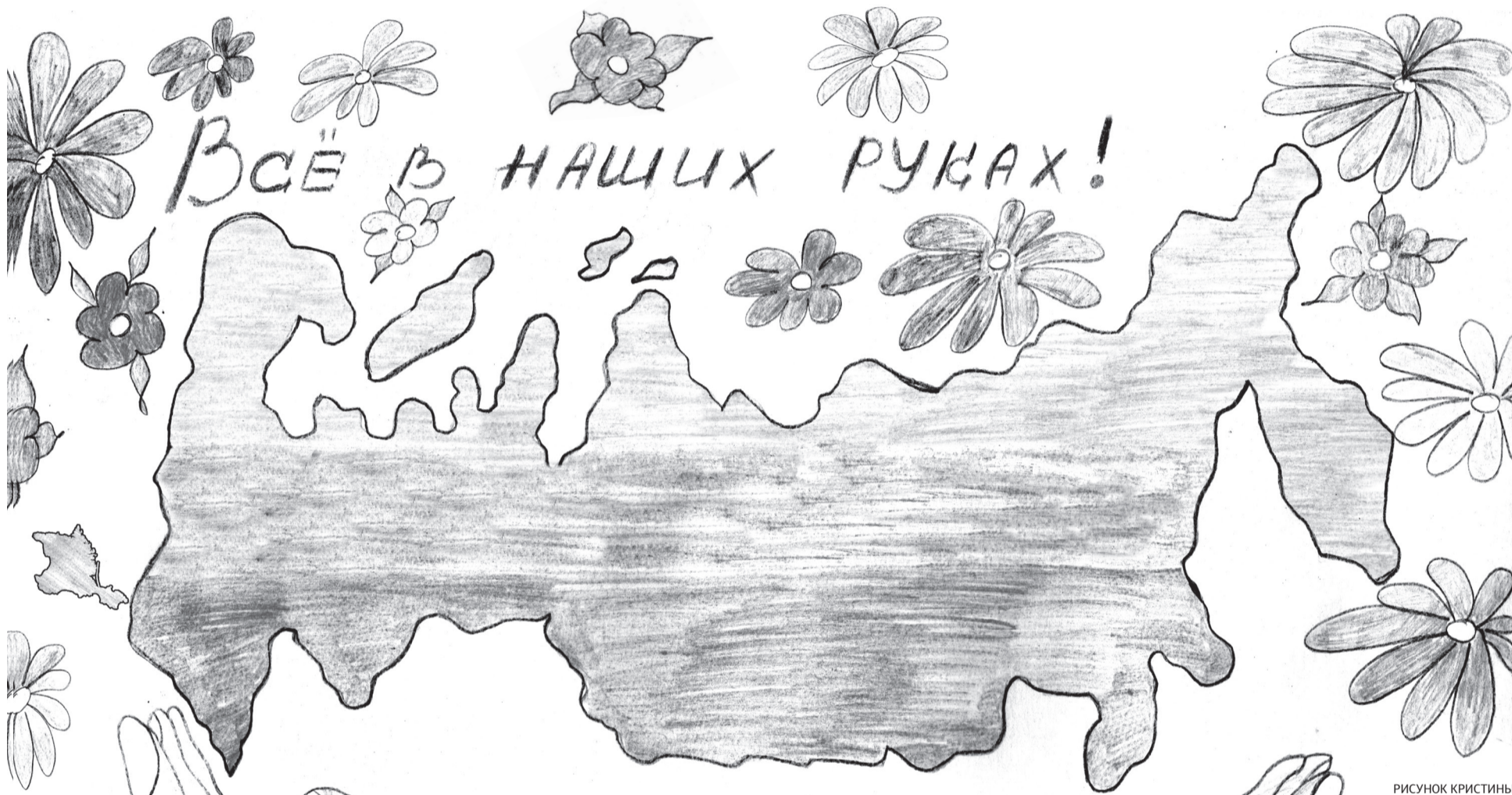
РИСУНОК КРИСТИНЫ МУСТАКИМОВОЙ, 10 ЛЕТ