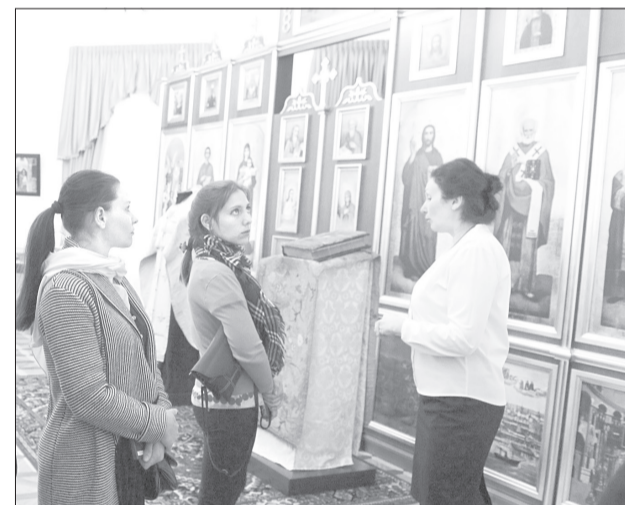
В большом зале, где семья проводила много времени, воссоздан иконостас

Последние пьесы. Но главное всё-таки даже не в уникальной экспозиции. Дело в том, что экскурсоводы некоторых исторических маршрутов, посвященных царской семье, настолько увлекаются рассказом о трагической гибели семьи, что просто смакуют каждую деталь их гибели. А в Тобольске сделали акцент на другом. Да, впереди у семьи уже отгремело от престола российского императора страшная смерть, и, скорее всего, старшие Романовы это понимают. Однако и царица, и сам Николай делают всё, чтобы окружить своей любовью детей, поддерживать друг друга. Поэтому экскурсоводы рассказывают гостям о домашних спектаклях по пьесам Чехова и Мольера, о рождественской елке, о том, что ма-