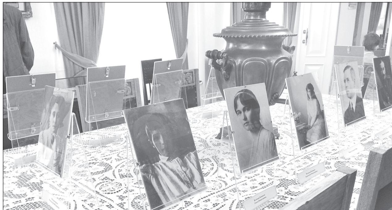
В таком порядке царская семья рассаживалась за обеденным столом, было здесь место и для врача Боткина

В Тобольске открыт музей императорской семьи