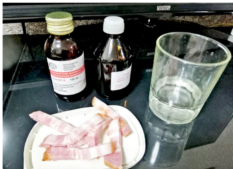
Продажа алкогольной и спиртосодержащей продукции без лицензии физическим лицам запрещена