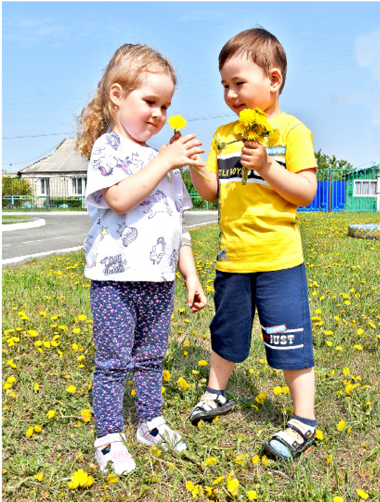
Воспитанники детского сада «Колокольчик» любят гулять на свежем воздухе

С первого июня в Казанском районе начнут работу 55 детских вечерних площадок по месту жительства, которые будут организованы в 25 населённых пунктах.