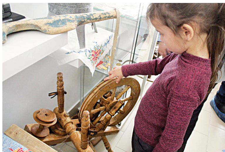
☞ Предки были мастеровыми людьми

Ложки на большой сцене. Успешно заявили о себе на первом региональном фестивале любительских творческих коллективов, который впервые проводился в этом году в Тюменской области, юные артисты из Тобольского района. Став дипломантами 1 степени на зональном этапе, участ-