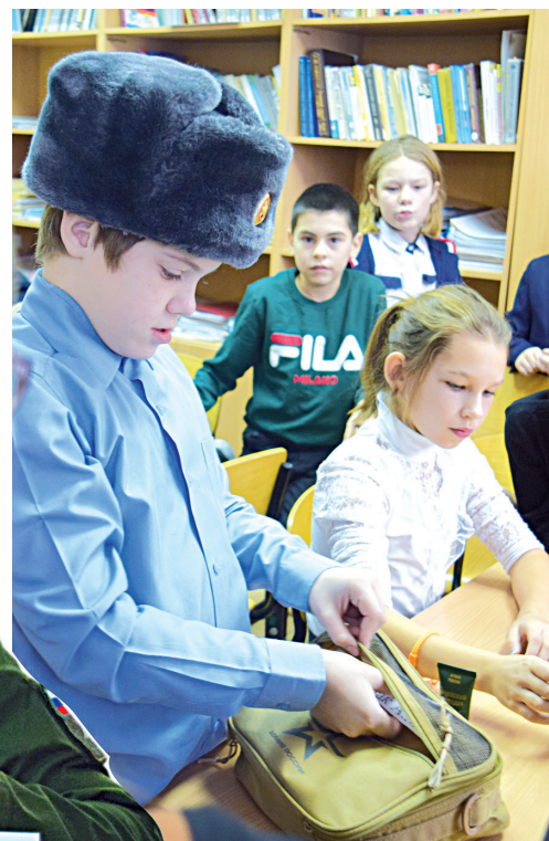
📷 Что интересного в сумке солдата

в армии – это важный, интересный и полезный опыт для каждого мужчины», – считают Аркадий и Андрей.