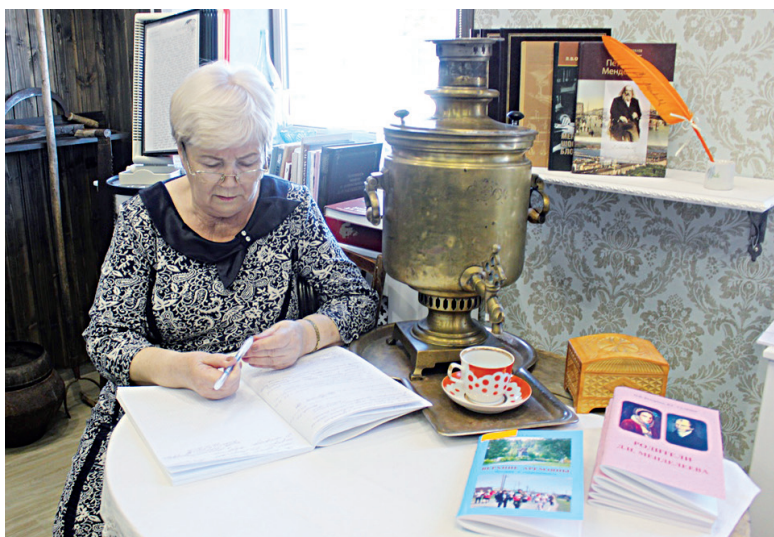
☞ Посетители делятся впечатлениями