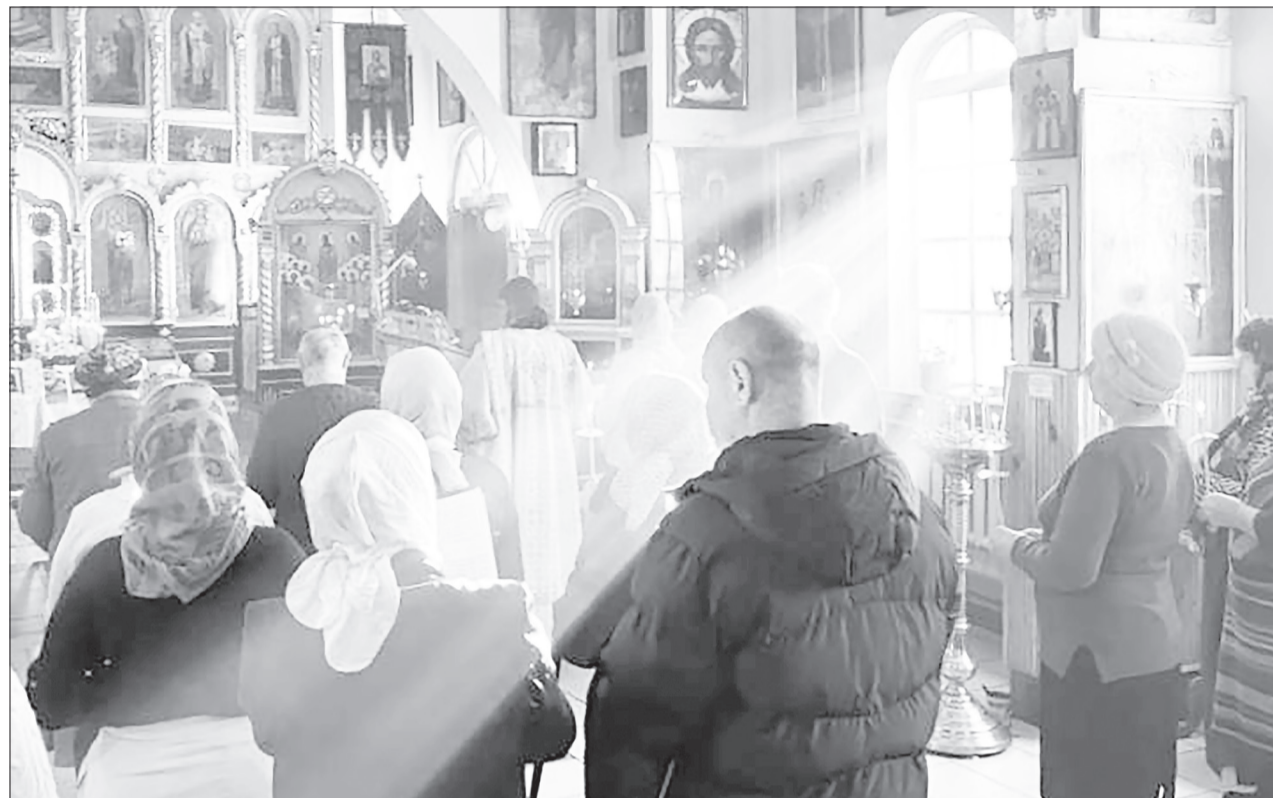
Православному человеку важно помнить, что ему есть к Кому обратиться