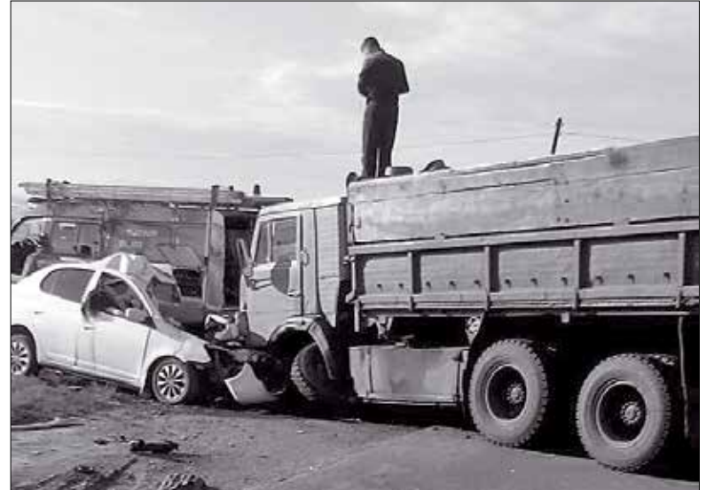
В августе в крупном ДТП погибли четыре человека