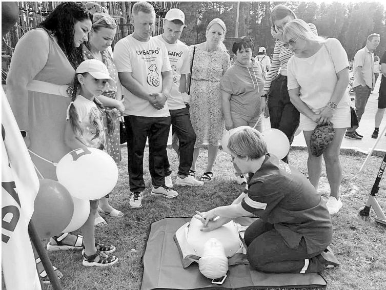
■ Сотрудники больницы на юбилей района показывали мастер-класс по первой помощи.

Лечебные процедуры. С 28 мая 2023 года в Велижанской амбулатории на ул. Социалистической открыт кабинет физиотерапии, который за истекший период уже посетили