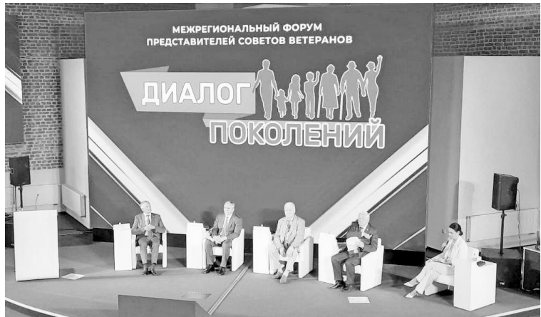
Губернатор Тюменской области открыл заседание форума «Диалог поколений».

Представители ветеранских организаций Тюменской области выступили с докладами по организации помощи семьям в воспитании и развитии детей, об освоении историко-культурного и национального наследия старших поколений как основы успешного развития детей, подростков и молодёжи, о