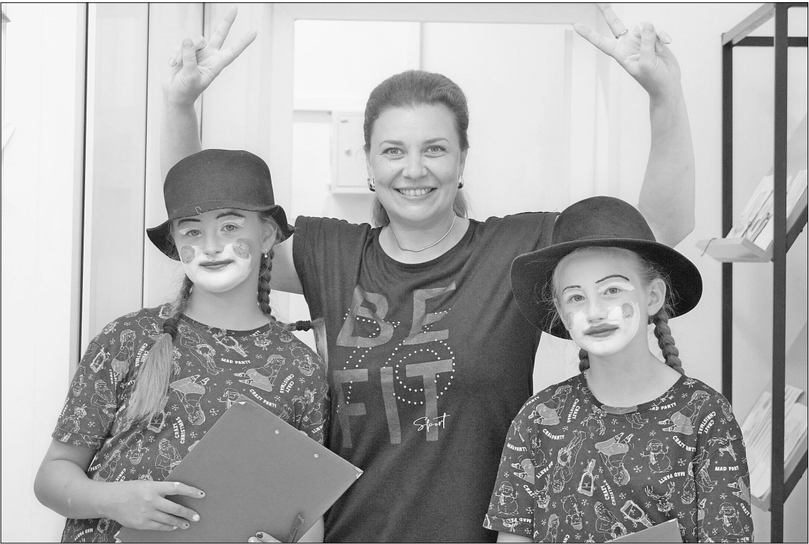
Главный залог хорошей смены – инициативность и творческий подход.

Когда в конце смены организаторы устроили опрос среди участников смены, на вопрос «Чего вам не хватало на смене?» половина ребят ответила: «Свободного времени». Также программа подразумевала несколько тематических площадок-мастерских: