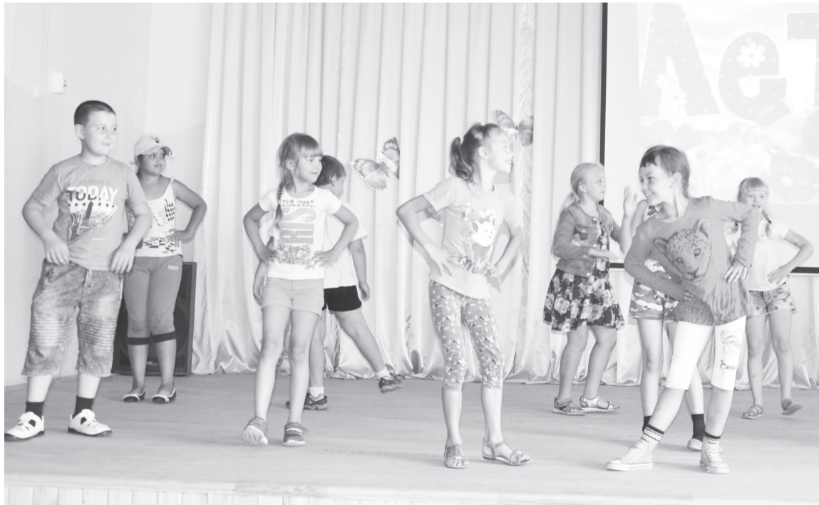
Дети ежегодно охвачены летним организованным отдыхом.

Пришкольные лагеря с дневным пребыванием детей и подростков почти на 100 процентов готовы к открытию в начале июля.