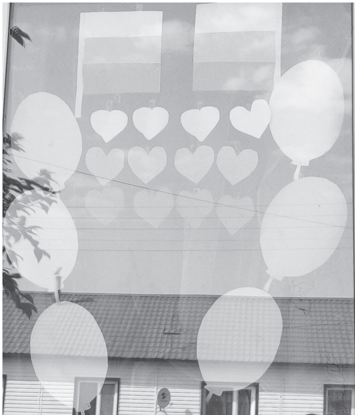
Украшение окон создаёт праздничное настроение.