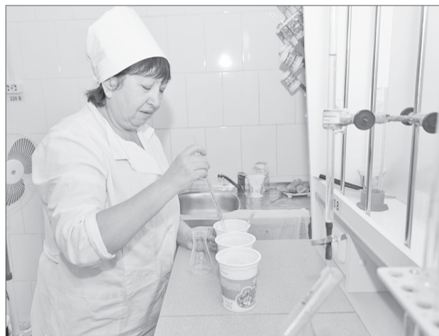
Жирность молока определяют в сырьевой лаборатории

ников, операторов машинного доения – всё должно быть направлено на улучшение качества.