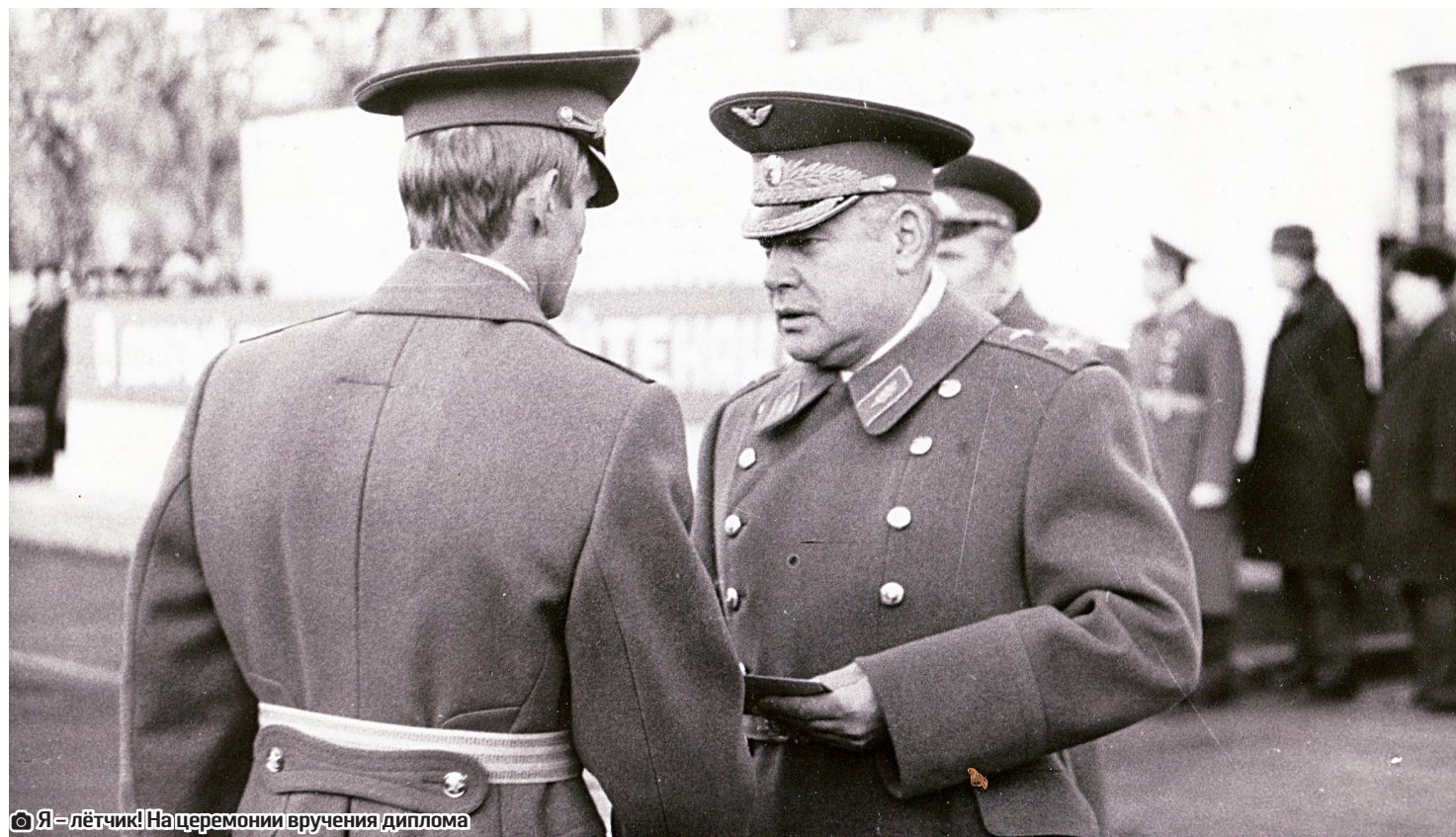
Я – лётчик! На церемонии вручения диплома