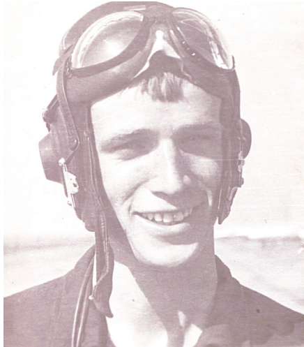
20 июля 1977 года. День самостоятельного вылета