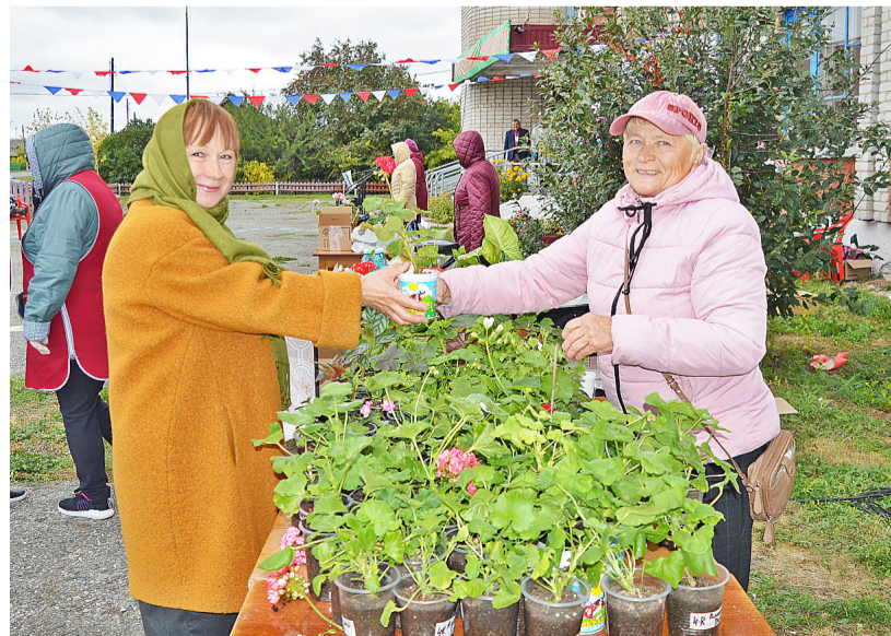
На празднике в Дубынке можно было приобрести красивые цветы

проходили мероприятия и в Казанском районе, позволил селянам отдохнуть и повеселиться.