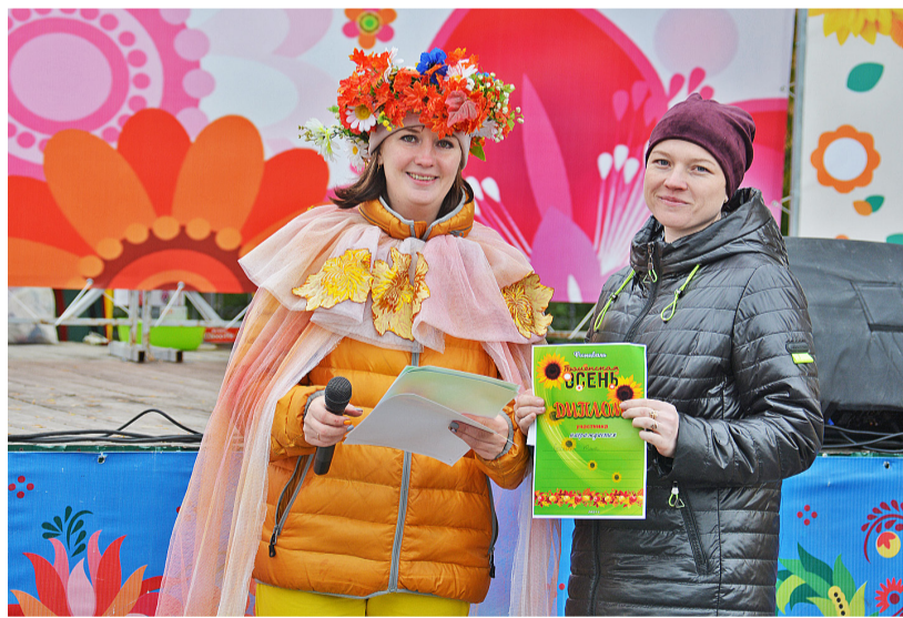
Участники фестиваля «Тюменская осень» были отмечены дипломами

Ф естиваль «Тюменская осень», в рамках которого