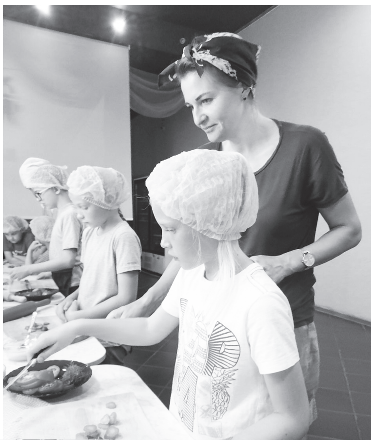
Мама всегда поможет и подскажет