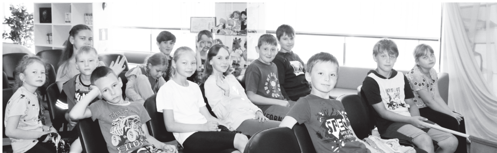
Юных юргинцев в дни каникул пригласили посмотреть музыкальную сказку с песочной анимацией

Виртуальный концертный зал в Юргинском открыли в рамках федерального проекта «Цифровая культура» при финансовой поддержке департамента культуры