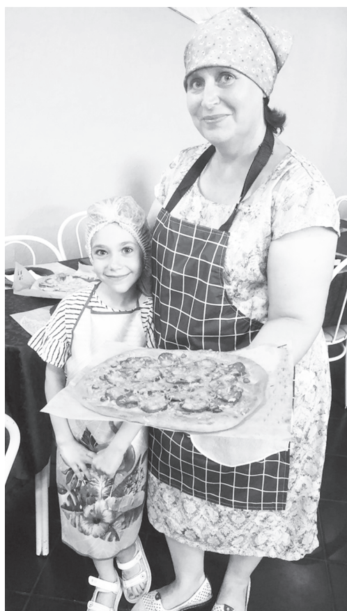
Пицца просто класс!