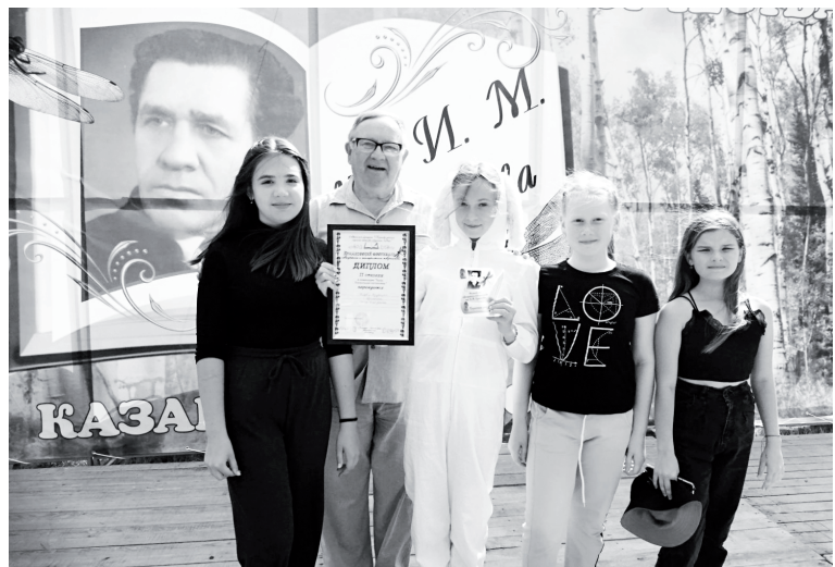
На фестивале авторского и театрального творчества

Каникулы – прекрасное время, чтобы посвятить себя любимым увлечениям. Школьные будни не всегда позволяют расслабиться и провести вечер за интересной книгой, а лето даёт возможность прочесть много интересного. О том, что же сейчас читают ребята и кто из них самый активный, рассказали работники Детской библиотеки.