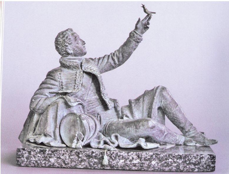
Парковый вариант скульптуры