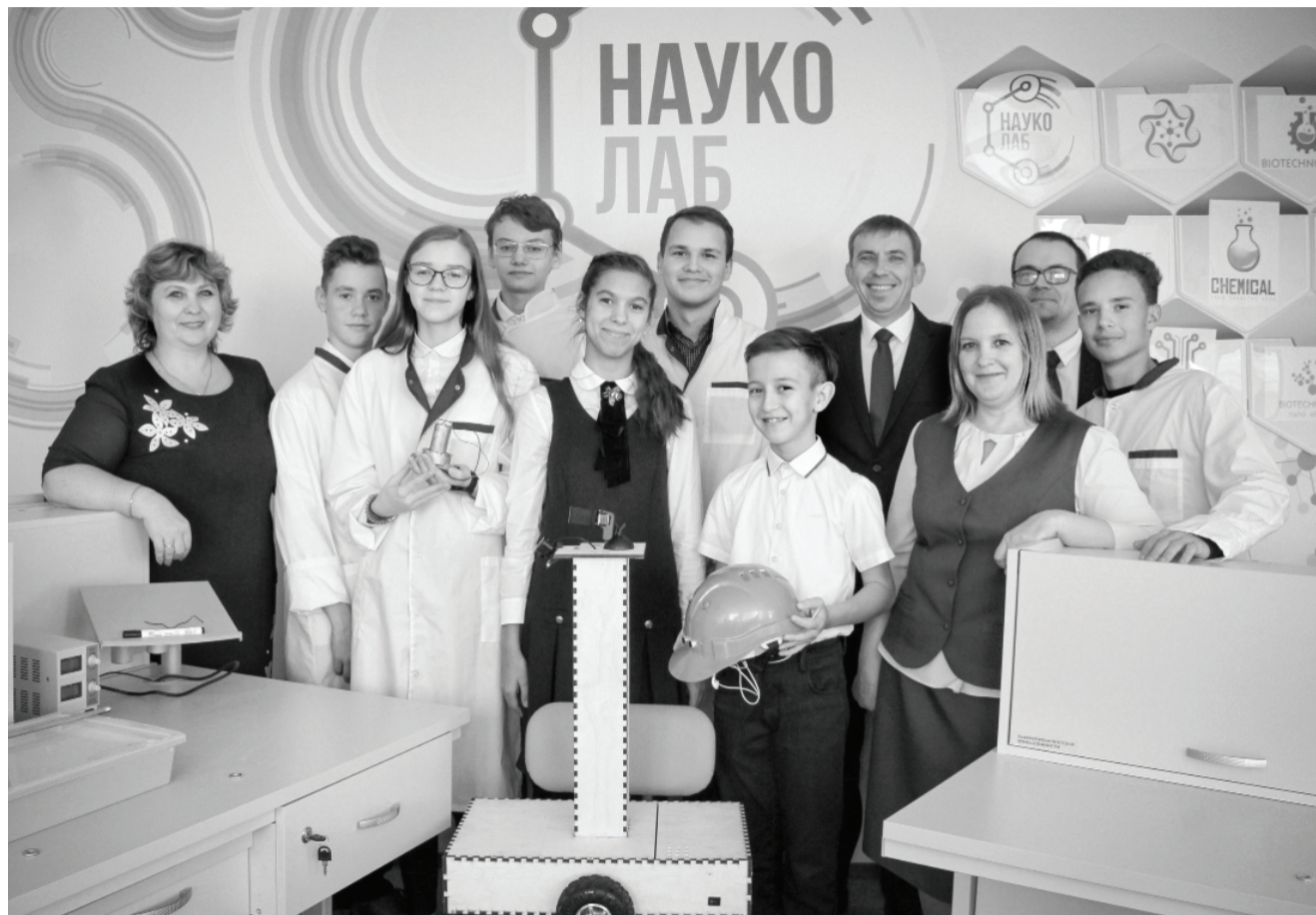
Из шестнадцати учеников школы № 8, которые приняли участие в областном форуме «Шаг в будущее», семеро заняли призовые места, восемь прошли на следующие этапы. // Фото Василия БАРАНОВА.

Успешно выступили на региональном этапе «Шага в