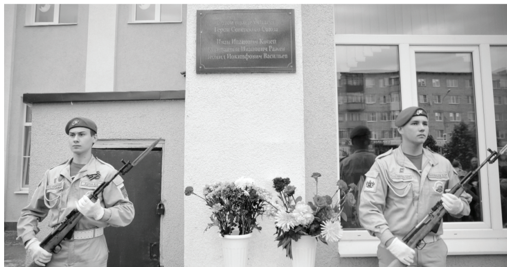
Мероприятия, посвящённые Героям Советского Союза, вызывают у юношества чувство гордости за Родину, служат развитию лучших качеств гражданина России.

УВАЖАЕМЫЕ ЧИТАТЕЛИ! Продолжается подписка на газету «Ишимская правда» на первое полугодие 2020 года.