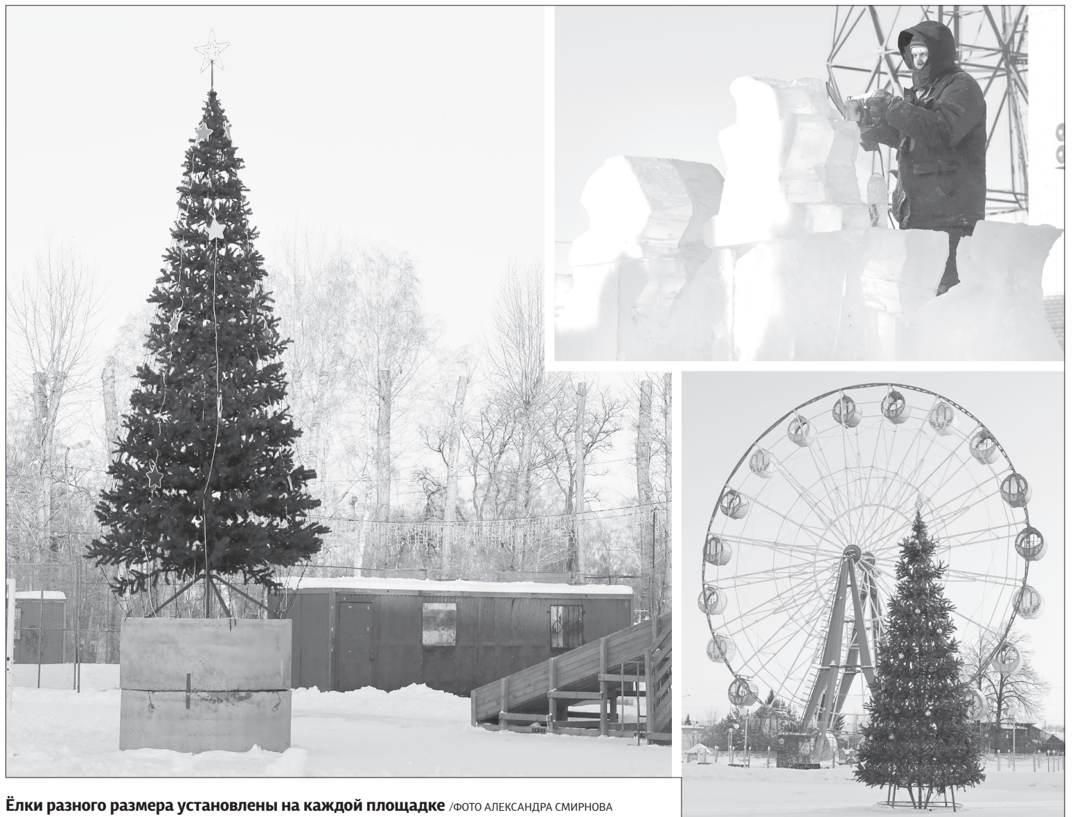
Ёлки разного размера установлены на каждой площадке

К двум традиционным площадкам добавится каток в городском саду