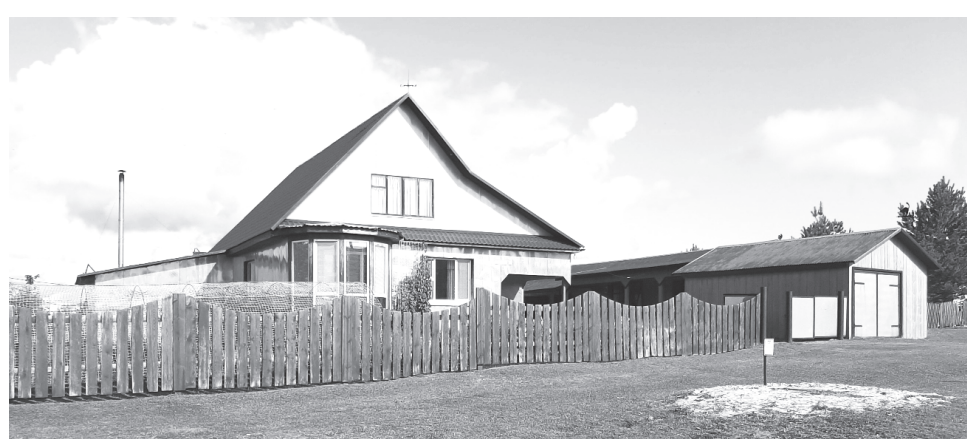
Дом мечты семьи Тютиных.