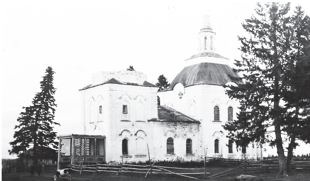
Храм во имя святых Прокопия и Иоанна Устюжских Чудотворцев (фото 1950-х гг.).

Лариса ФИЛАТОВА