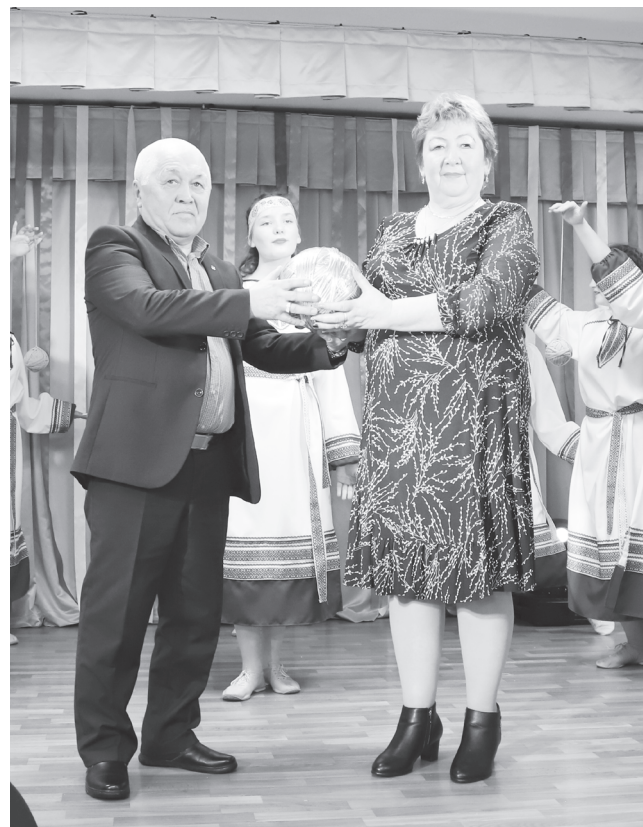
Клубок юбилейной эстафеты приняло Укинское поселение.