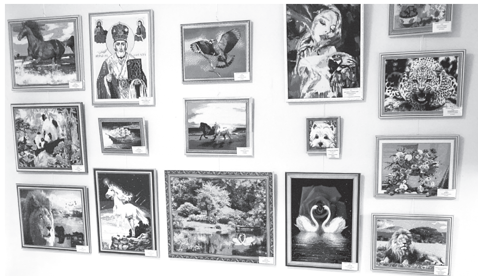
Работы мастериц Юровского сельского поселения.