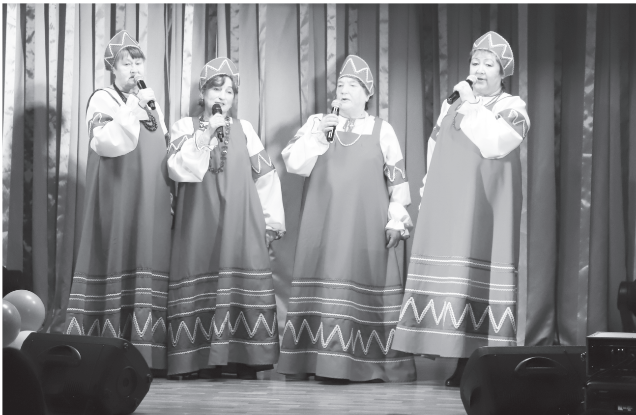
Вокальный коллектив «Импровизация».