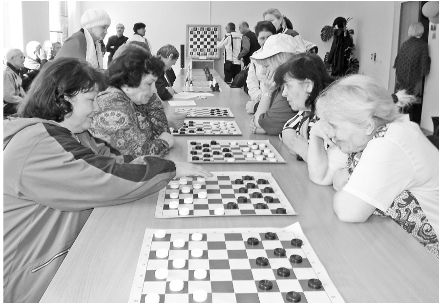
Пенсионерки за интеллектуальной игрой.