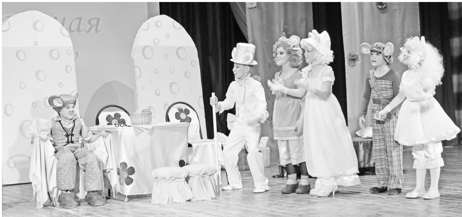
Финальная сцена выступления лауреатов конкурса (Тюневский СДК).

Ярким и зрелищным получился районный конкурс «Театральная весна-2016», посвященный Году кино в России.