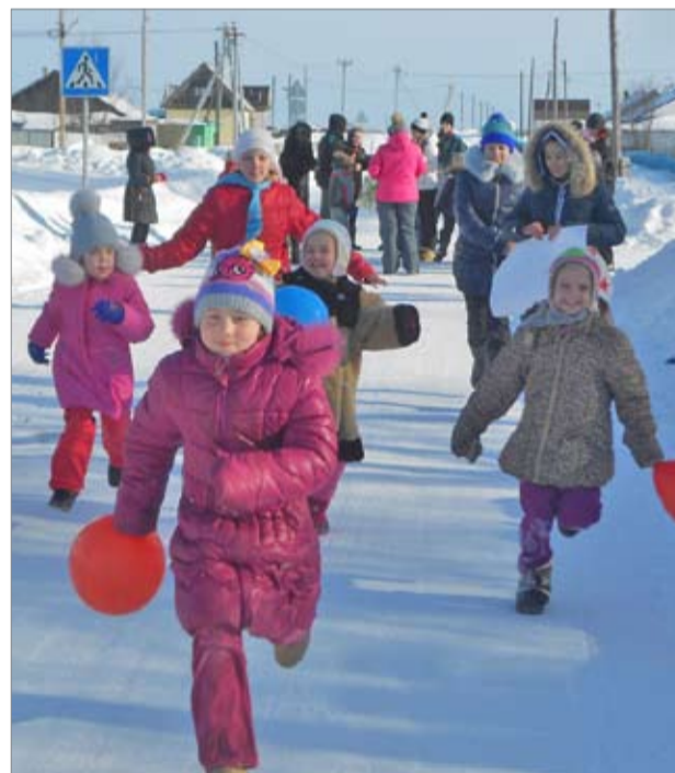
Зарница в Овсянниковой