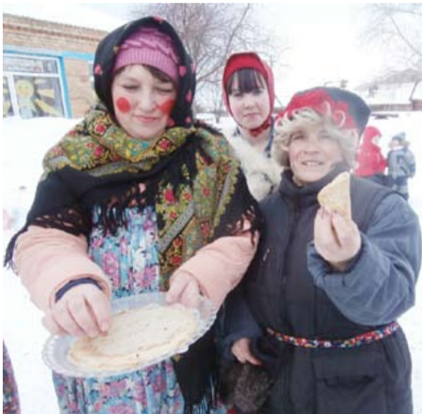
Масленица в Ушарова