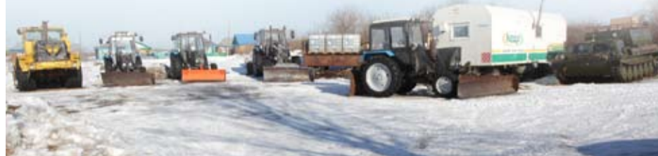
Техническая база «Агроспецтранса»

Единственное удовольствие, которого были лишены автопутешественники, - это поездка по зимнику в вечернее время, когда направление главной дороги в Заболотье показывают высокие красно-белые светоотражающие вешки, расставленные по обеим сто-