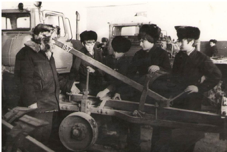
Учащиеся ПТУ-54 проходят производственную практику, 80-е годы

По окончании 8 классов в ПТУ-54 можно получить профессию тракториста-машиниста широкого профиля с умением выполнять работы слесаря-ремонтника; водителя автомобиля; повара; швей-мотористки. С 10 классами - выучиться на водителя-автослесаря и повара.