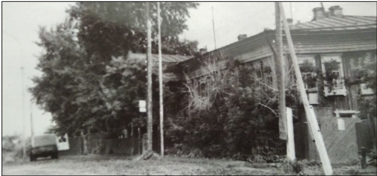
• Здание старого военкомата по ул. Ленина в Аромашево.