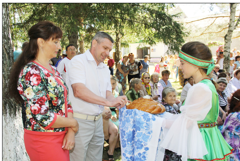
• Традиционная встреча гостей хлебом и солью.

На данной тематической странице мы неоднократно знакомили наших читателей с различными мероприятиями в рамках национальных праздников, проводимых на территории района и области, в которых активно участвуют аромашевцы. Это и Дни чувашской культуры, и Рамадан, Ураза-Байрам и Акатуй. Этот выпуск посвящён районной программе развития русской народной культуры «Горница», которая проходит с 2016 года и знакомит с культурой, историей и национальным бытом, устным народным творчеством жителей района. Отрадно, что в фольклорных праздниках принимают участие не только русские, но и представители всего многонационального населения Аромашевской земли. Это и чуваша, и белорусы, а также татары, украинцы и многие другие.