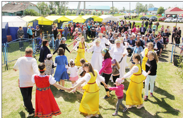
• Хоровод – неотъемлемая часть народного праздника.