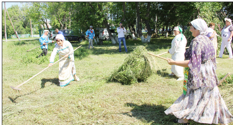
• Заготовка сена – важная работа крестьян.