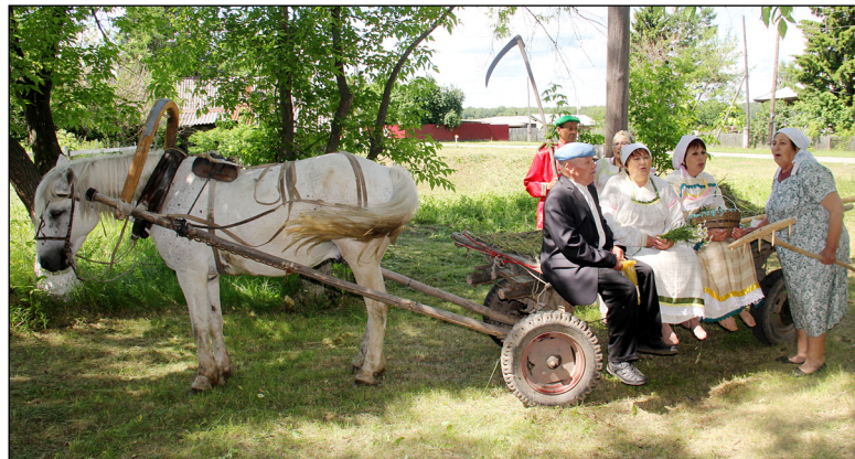
• Лошадь была главным помощником на деревне.