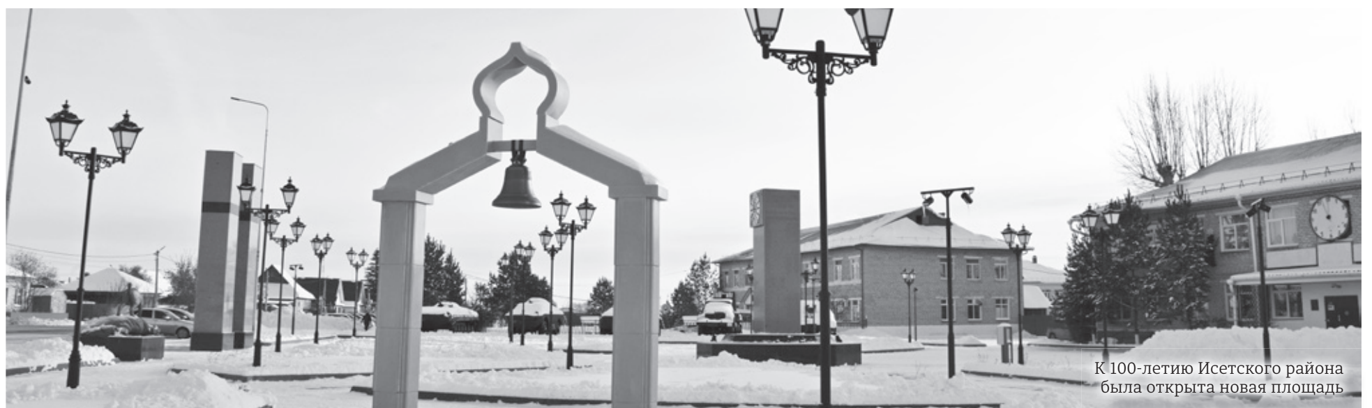
К 100-летию Исетского района была открыта новая площадь

Реорганизация верхнеингалской восьмилетней школы в среднюю, 1994 год