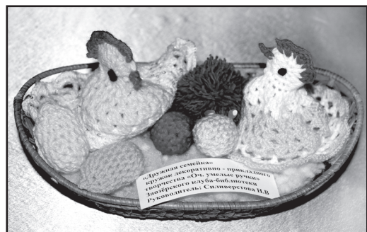
Выставка работ на пасхальную тему

Т. УСОЛЬЦЕВА