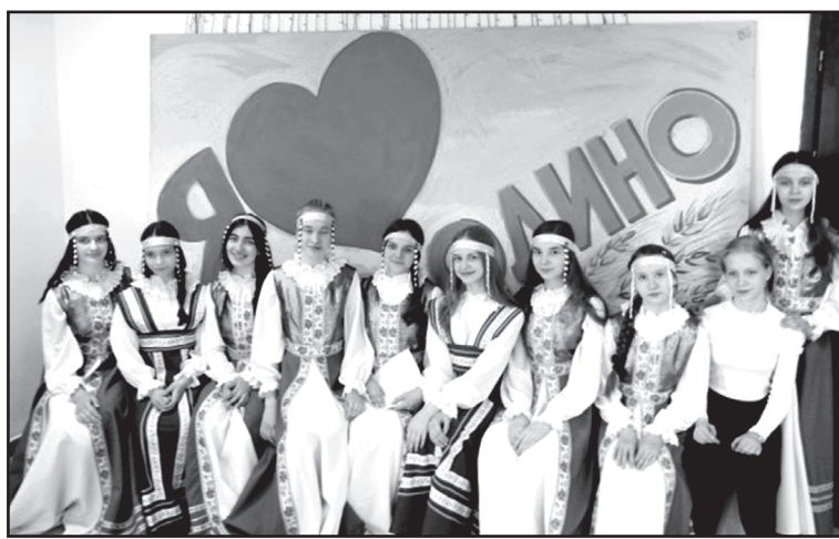
Вокальный коллектив «Пасхальный букет»

Не перестаю удивляться глубине и силе текстов песен, которые хочется запоминать, так похожи они на фразеологическую речь: «И если хочешь стать красивым, ты добротой поделись», «Если у меня есть край любимый – значит, я счастливый человек». Самые