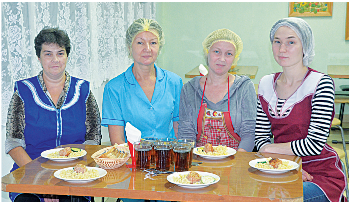
Дружный коллектив накормит всех

Дню работников пищевой промышленности. В канун их профессионального праздника мы заглянули в столовую Прииртышской средней школы