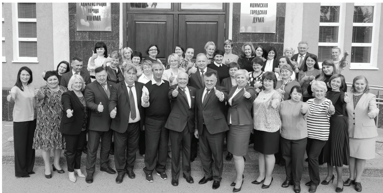
В диалоге лидеров профсоюзов участвовали представители Тюмени, Ханты-Мансийска, Ялуторовска, Тюменского, Омутинского, Ишимского и других районов.

Две строительные организации позволяют выполнять программы по предоставлению жилья молодым семьям, детям-сиротам, по социальному найму. Действительны и программы по формированию комфортной городской среды, в том числе с привлечением грантов за победу в федеральных конкурсах. Важно введение в эксплуатацию газораспределительной