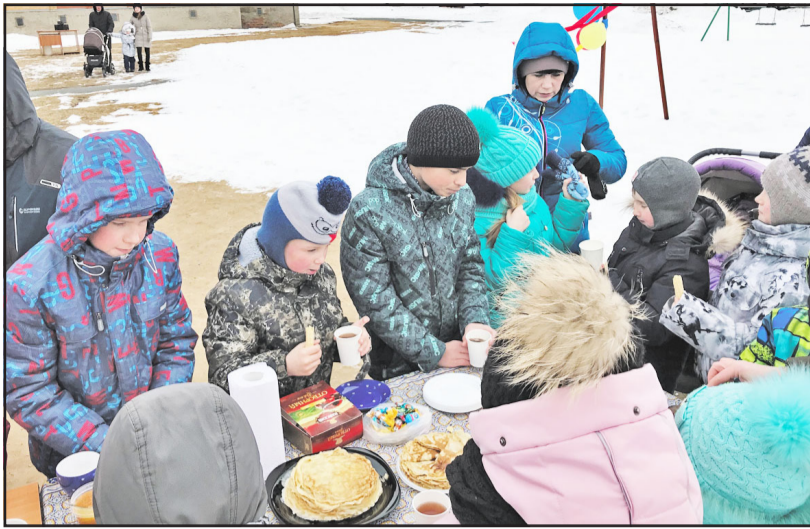
Какая же Масленица без блинов и горячего чая

Жители военного городка отметили завершение Масленицы весёлым праздником, который организовали жёны военнослужащих. Праздничные гулянья прошли в народных традициях: с блинами и горячим чаем из самовара.