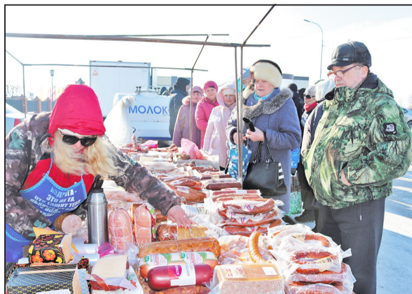
Во время уличной торговли омские полуфабрикаты, колбасы, копчёное мясо, сало, рулеты всегда пользуются спросом у покупателей

машнее молочко, творог, сметана и сливочки также пользовались спросом у посетителей ярмарки. Кроме того, можно было купить товары для дома, сада и огорода, рыбалки, спецодежду и прочие предметы хозяйственно-бытовой направленности. Всё это торговое мероприятие сопровождалось весёлой культурно-массовой программой.