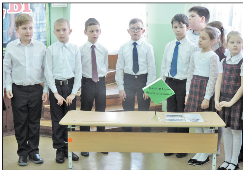
Проект «Парта героя» вызвал у ребят интерес