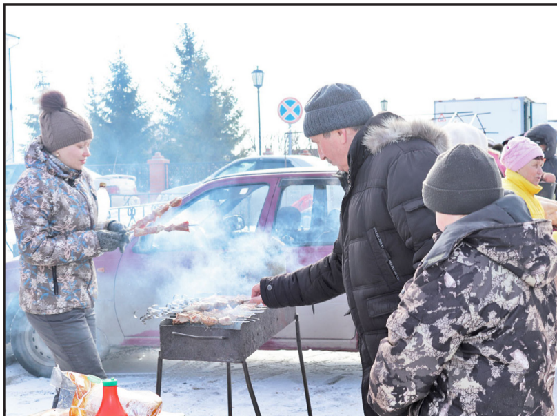
По количеству выставленных мангалов впору устраивать конкурс на самый вкусный шашлык