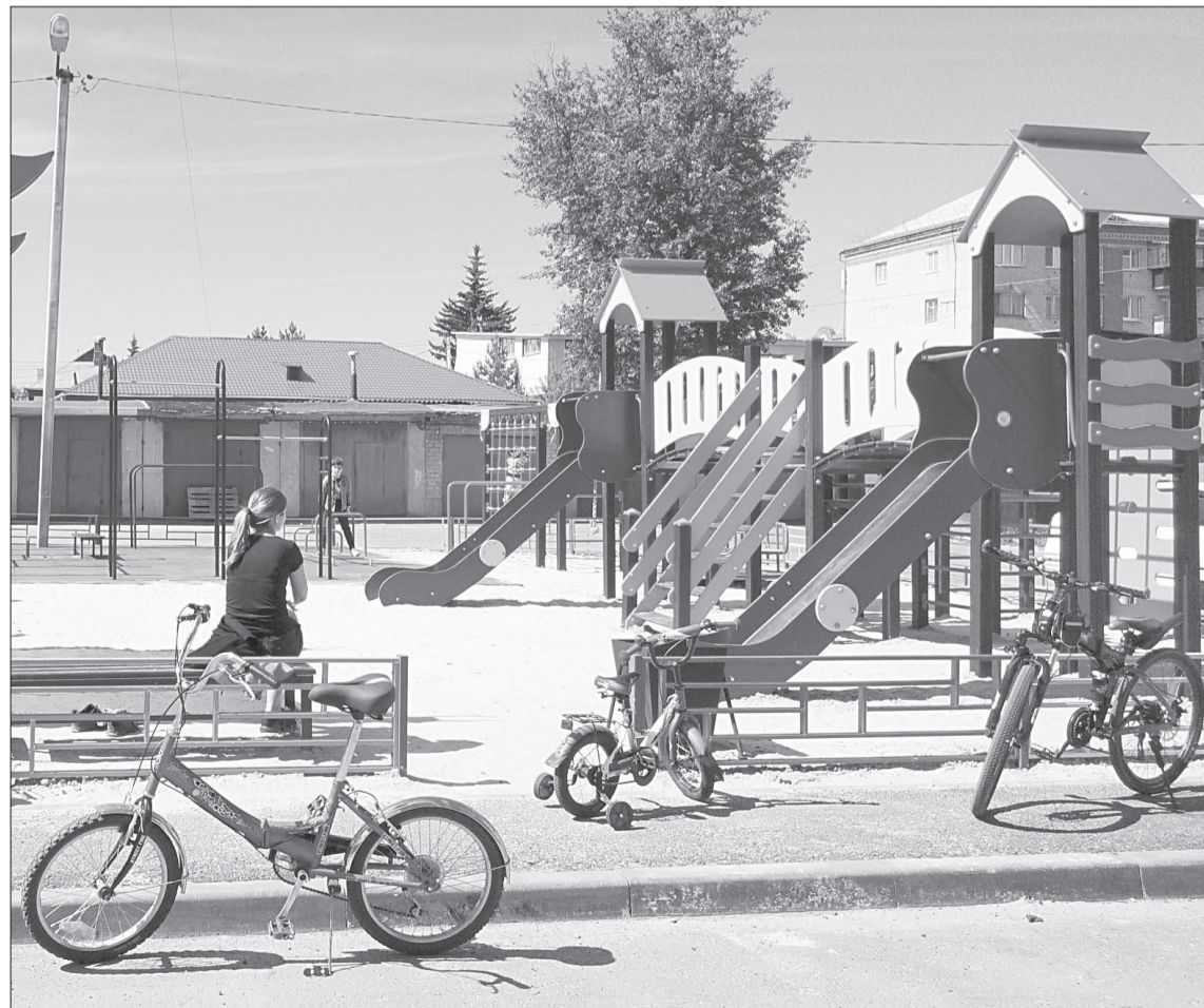
Новая детская площадка на Вокзальной, 15 редко бывает пустой