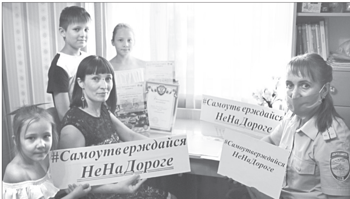
Участники акции сделали фотографии с хештегом акции и разместили их в социальных сетях. Это поможет рассказать о мероприятии как можно большему числу жителей города и района и призвать их самоутверждаться только в добрых делах