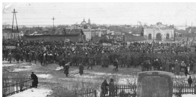
Ноябрьская демонстрация на Базарной площади в военные годы.

Внимание уделяли и борьбе с таким крайне опасным для человека заболеванием как бешенство, основным переносчиком которого являлись заражённые собаки. 4 сентября 1942 года принимается решение «к 1 октября текущего года провести регистрацию собак, запретить нахождение собак на улице и дворах без намордников и без привязи». При обнаружении заболевания бешенством собаки должны были немедленно уничтожаться, трупы их сжигаться или зарываться в скотомогильнике. Горкомхоз обязали «вылавливать безнадзорных собак и уничтожать их». Нарушители данного постановления подвергались «в административном порядке штрафу до 100 рублей или принудительным работам до одного месяца». Горсовет обязал к 20 сентября 1942 года произвести полную