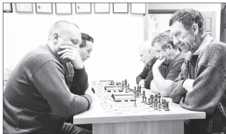
На раздумья в партии всего 15 минут.

В Упоровском Доме прессы состоялся второй шахматный турнир на призы газеты «Знамя правды». Первый был проведён в июне этого года, он собрал десяток спортсменов. Во втором за победу решили побороться 14 человек.