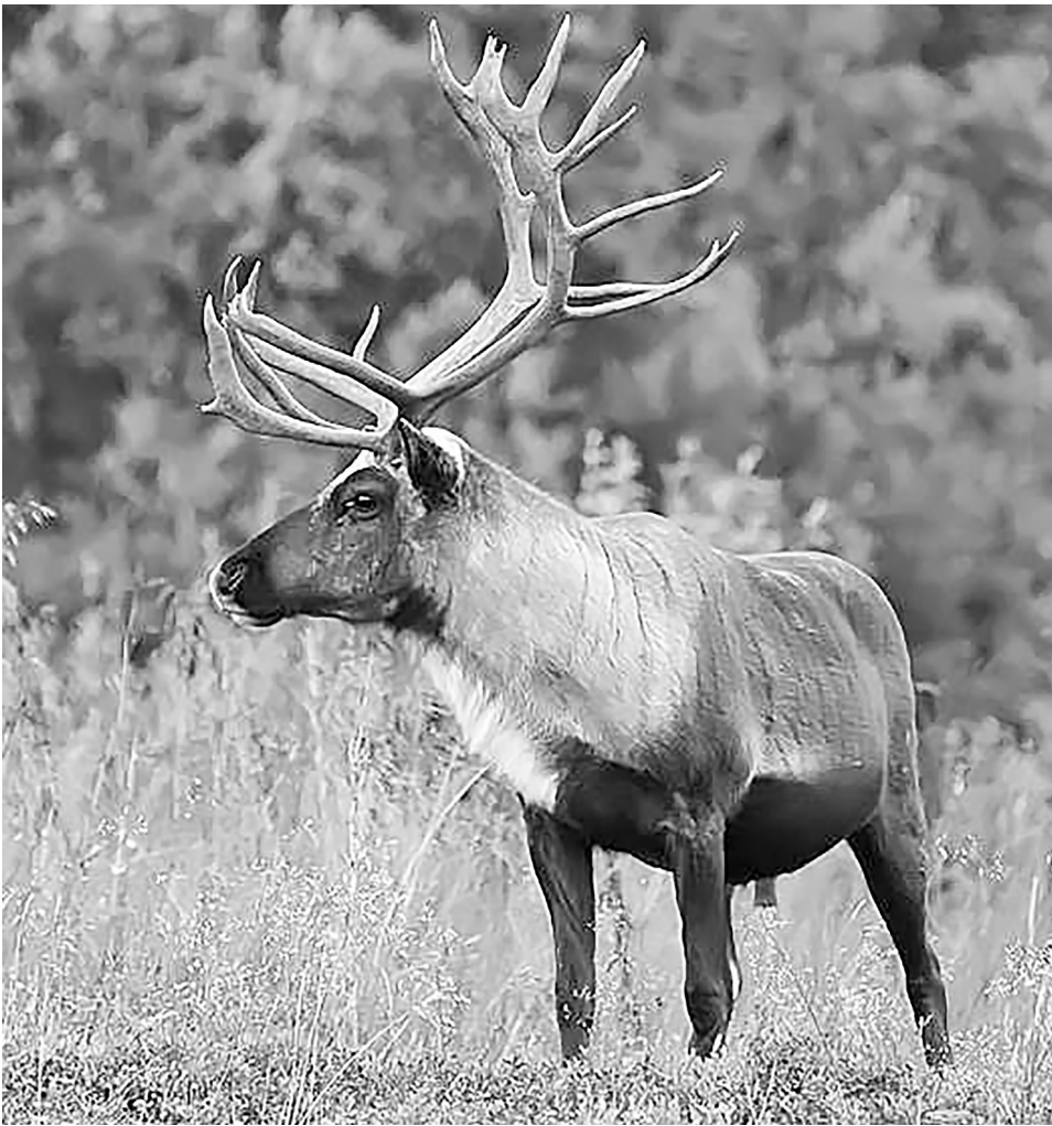
Поправки, касающиеся охраны окружающего мира, помогут защитить природу, а вместе с ней и человека.

кального природного и биологического многообразия страны». Конечно, бережное отношение к природе должно закрепиться в сознании людей: не сломай ветку, убери за собой мусор, сохрани жизнь животному. Эти понятия должны стать равносильными библейским словам «не убей, не укради». Поэтому необходимо развивать экологическое образование граждан, что также предлагается в новой поправке к Конституции.