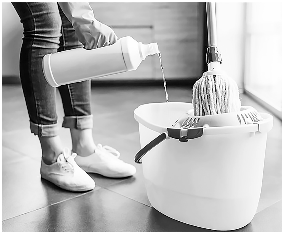
По рекомендации Роспотребнадзора, в ближайшие недели подъезды необходимо убирать с применением хлорсодержащих препаратов. Отсутствие этой работы — повод обратиться в управляющую компанию.