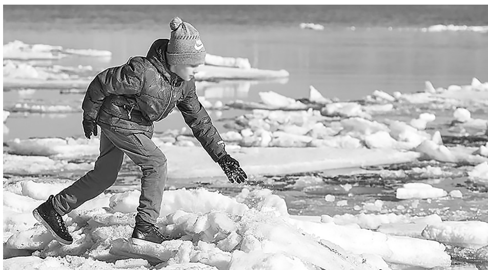
Детская шалость может плохо закончиться, поэтому не разрешайте детям посещать водоёмы в период ледохода.

— При оказании помощи терпящим бедствие на воде используйте лодки, спасательные круги и нагрудники, а также любые предметы, имеющие хорошую плавучесть. Чтобы спасти пострадавшего, можно бросать в воду скамьи, лестницы, доски, обрубки брёвен, привязан-