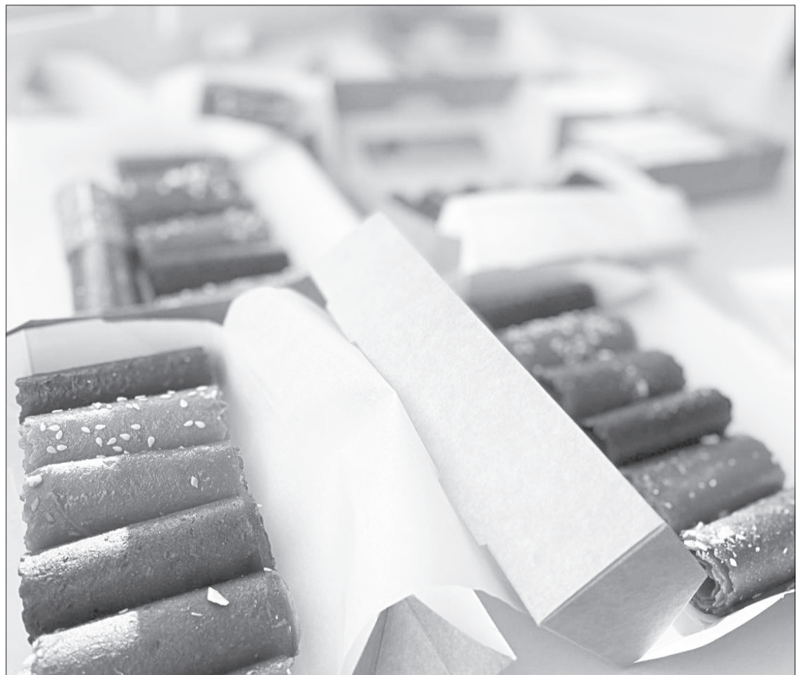
Ялutorовскую пастилу готовят на специальном оборудовании - дегидрататоре - при температуре от 45 до 55 градусов, так в ней сохраняется до 97% полезных веществ

Ещё одна наша энтузиастка Алла Тупицина рассказала о пастиле, которую производит. В отличие от магазинной сладость не содержит стабилизаторов, загустителей, красителей и сахара – только фрукты, ягоды и мёд. Сейчас в ассортименте десять видов, как с привычными вкусами (яблочная, вишнёвая, клубничная), так и с необычными – ежевичная или яблочная с добавлением тыквы. Фасовка разная: наборами в подарочных коробках разных размеров или ассорти в пластиковых стаканчиках. Сейчас производитель подбирает название своему бренду, один из рабочих вариантов – «Ялutorовские сласти».