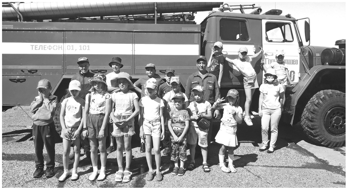
Особый интерес у детей дошкольных лагерей во время экскурсии в пожарно-спасательную часть вызвали служебные автомобили

Летом пожарные 110-й пожарно-спасательной части 27-го отряда ГУ МЧС России по Тюменской области продолжают проводить экскурсии для школьников и воспитанников детских садов.