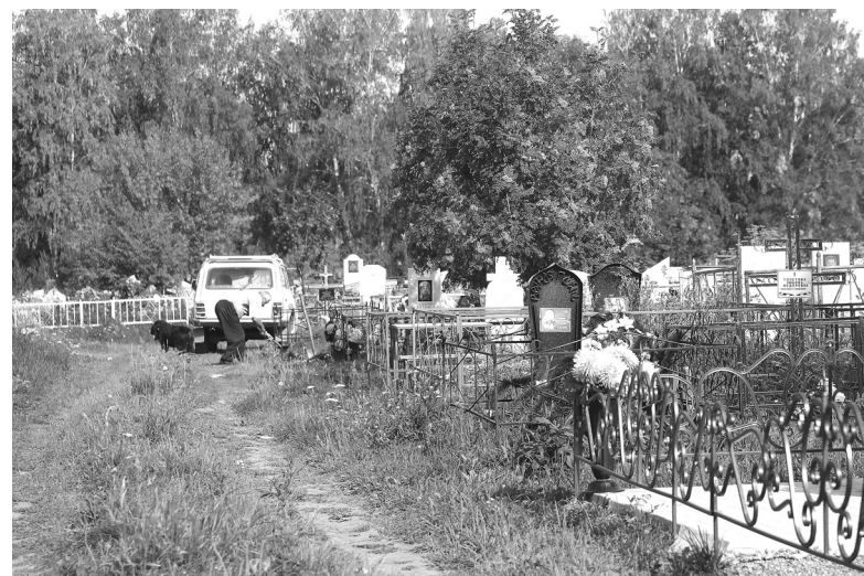
На кладбище постоянно приезжают люди, чтобы на захоронениях навести порядок. Поэтому и подрядной организации необходимо постоянно следить за наполняемостью контейнеров и оперативно вывозить кучи из травы, веток, старых венков

Наталья ГЛАДКОВСКАЯ