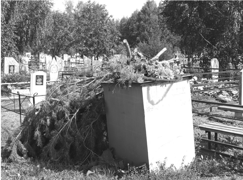
После родительского дня и Троицы на поселковом кладбище контейнеры стояли переполненные

Для многих из нас кладбище – это про скорбный долг, а не про комфортную среду. Люди приезжают на кладбище в дни похорон да по церковным праздникам, а всё остальное время сторонятся.